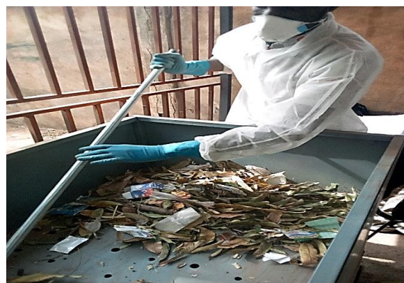
Figure 1 : criblage des ordures sur la table de tri

Au cours du tri, cinq (5) fractions ont été triées. Il s'agissait : des hétéroclites, la fraction >100 mm, la fraction <100,20>, la fraction <20,10> et la fraction <10 mm.