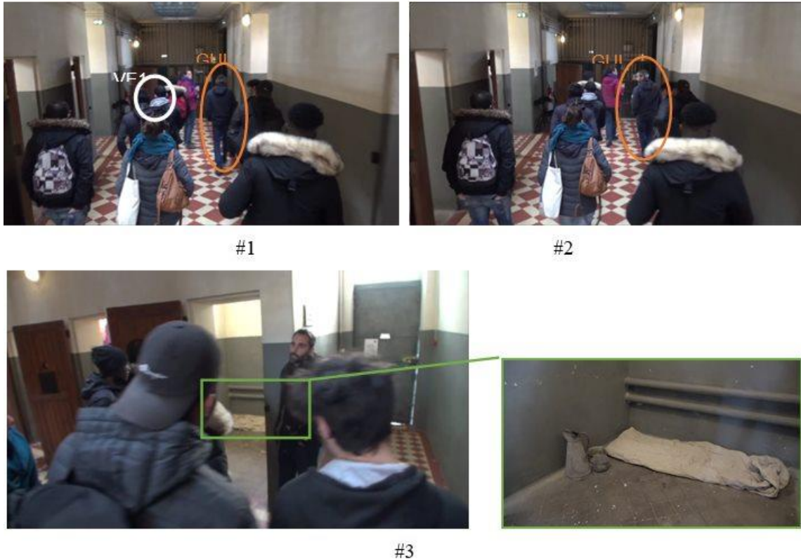
Figure 3. Images 1, 2 et 3 de l'extrait « Reconstitution un peu toc ». MNPM, le 07.01.20

Elliptique à propos des personnes désignées par « on » (dans « on est en train d'essayer de se mobiliser », qui est ce « on » ?), le discours du médiateur (GUI) nous fait néanmoins observer que cette mobilisation collective pour remplacer la paille relève d'une préoccupation éthique de montrer les différentes évolutions de la vie de ce bâtiment, à la fois sur le plan socio-politique (enjeux de pouvoir entre personnels et détenus ; évolution des traitements réservés selon les lois en vigueur) et sur le plan technologique (la présence d'une paille à la place d'un lit en métal rend compte d'un savoir-faire et d'une innovation matérielle).