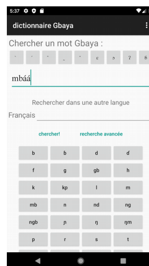
Figure 1: Page principale