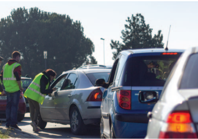
Blocages en France (gauche) et plan de blocage diffusé sur les réseaux sociaux (droite) en novembre 2018

Professeur des universités en sciences de gestion et du management – Aix-Marseille Université (AMU)