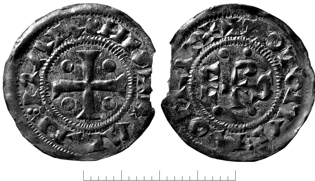
Рис. 3. Денарий нормандского герцога Ричарда I из клада Скёггс, аверс и реверс, Готланд, Швеция (SHM 7353).