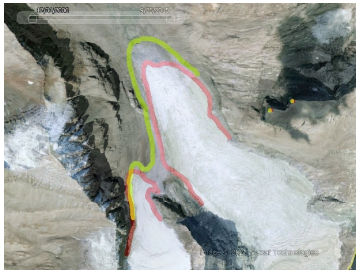
Figura 2: Le immagini di Fig.1 sovrapposte per il confronto.