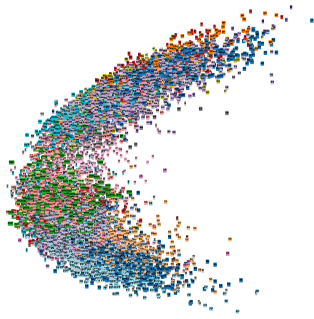
FIGURE 3 – Visualisation des plongements issus de sous-DNN