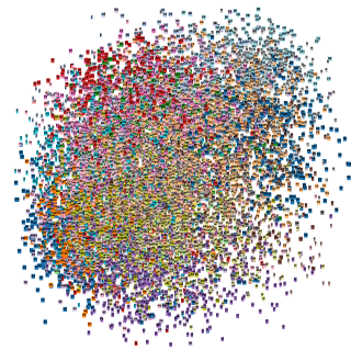
FIGURE 4 – Visualisation des plongements issus de sur-DNN

plongements résultants de X-LSTM permettent une synthèse par sélection d'unités satisfaisante (cf. Tableau 1). Plus d'informations sur les modèles, les attributs utilisés et les performances associées sont disponibles dans (Perquin et al. , 2018).