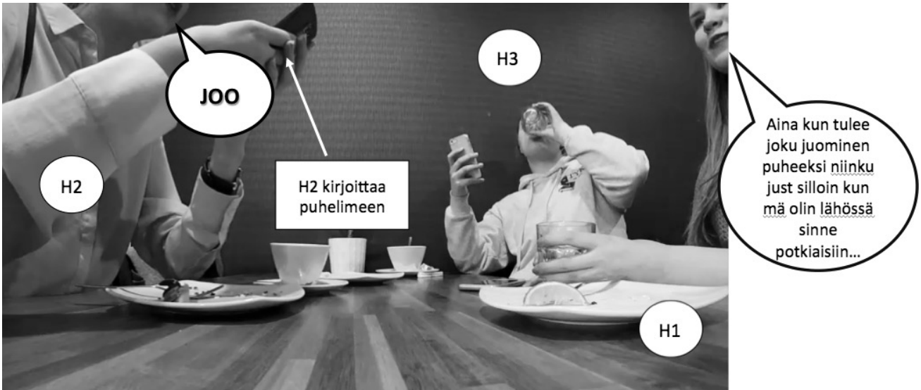
Kuva 3. Laitetta käyttävä pysyy minimipalautteiden avulla keskustelussa mukana

Suomen kielessä dialogipartikkelin “joo” käyttäminen nähdään usein joko kuulijaksi asettautumisena, samanmielisyyden osoittamisena tai keskustelusekvenssin päättämisenä (Sorjonen 2001). Esimerkissämme “joo” osoitti erityisesti kuulolla oloa, sillä Henkilö 2 kirjoitti koko ajan samanaikaisesti jotain älypuhelimellaan peukaloitaan käyttäen. Samalla esimerkistä voi nähdä medialaitteen tahmeuden, kun joo-partikkelit eivät osukaan “siirtymän mahdollistaviin kohtiin”, joiden yhteydessä ne yleensä esiintyvät. Tavallisesti partikkelit ovat siis sellaisissa kohdissa, joissa puheenvuoro voi vaihtua toiselle henkilölle ja joita yleensä edeltää pieni tauko, mutta tässä esimerkissä Henkilö 2 tuottaa joo-partikkelit ”ohi” niiden tyypillisistä esiintymiskohdista. Tämän voi nähdä ilmentävän sitä haasteellisuutta, joka seuraa vuorovaikutuksesta kahdessa eri temporaalisessa järjestyksessä: samaan aikaan kun Henkilö 2 pitää joo-lausumillaan yllä osallisuuttaan keskusteluun, hän ei kuitenkaan aivan kokonaan ole tämän osallistumiskehikon käytettävissä.