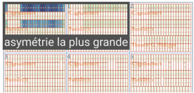
FIGURE 5. Asymétrie de durée entre voyages aller et retour depuis trois lieux en fonction de l'heure. Ils représentent normalement que les zones accessibles depuis un point de départ à une heure donnée, et selon des modes de transport précis.

Démo 3 : asymétrie isochrones. Cette dernière démo, s'intéresse aux variations en fonction de l'heure, du lieu de départ, du sens du trajet, ou de la direction de déplacement. En effet les isochrones ne