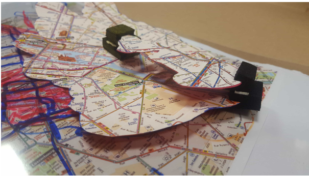
FIGURE 3. Processus de conception des isochrones étendues : prototypage papier collaboratif.