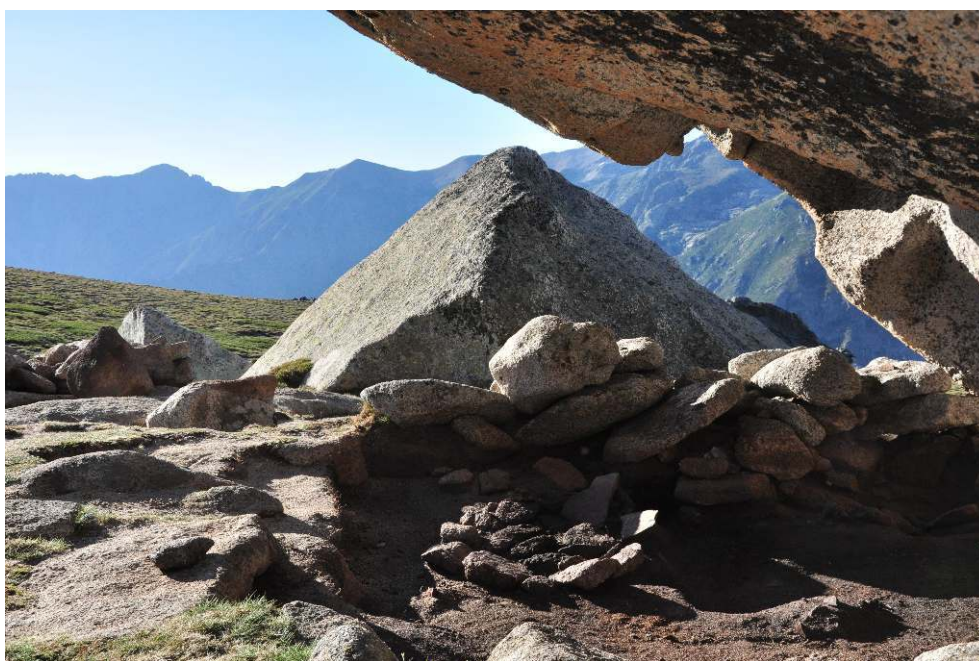
Fig. 1 – ABRI DES CASTELLI