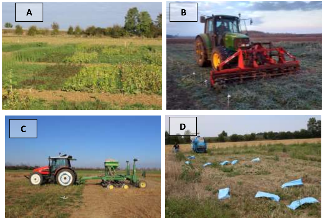
Figure 3 : Plateforme d'essai à l'INRA Dijon (Domaine d'Epoisses) sur les couverts d'interculture et leur effet sur les adventices sous divers niveaux de ressources et modalités de conduite. (A) couvert de 2 ou 8 espèces, avec ou sans légumineuses 60 jours après semis. (B) destruction d'un couvert au rolofaca sur le gel au 15 décembre. (C) Implantation de l'orge de printemps au 15 mars en semis direct. (D) récolte à la moissonneuse-batteuse expérimentale des micro-parcelles d'orge de printemps conduites sans azote et sans désherbage. (Crédit photo : Cordeau Stephane).

efficientes dans des niveaux de ressources en eau (Cordeau et al. , In prep) et en nutriments faibles (Moreau et al. , 2014). Il est donc nécessaire d'étudier les capacités de compétition des espèces de couverts dans des niveaux de ressources réduits ainsi que les possibilités de piloter la conduite des couverts (Figure 3, choix espèces, densité de semis, répartition de semis, irrigation potentielle, date de destruction, mode des destruction, etc...), pour maximiser leur installation et leur chance de concurrencer les adventices.