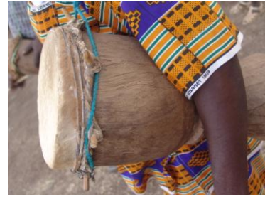
Fig. 4 : ñékédépèt

Il est toujours accroché à l'épaule. C'est lui qui marque les pauses, le changement des rythmes et produit une mélodie agréable à l'oreille. Il fait des mixages et produit un son léger. Il appartient aux Keita.