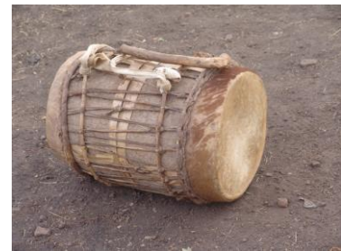
Fig. 2 : biñjuŋ juŋ ɓaparam

C'est une paire de deux gros tambours qui portent le même nom que l'ensemble des quatre, on ajoute seulement le superlatif ɓaparam pour montrer qu'ils sont gros. Ils produisent une sonorité lourde. L'un appartient à la famille Camara : c'est-à-dire à la grande famille qui regroupe tous les bedik qui portent les noms Camara, Samoura, Sadiakhou et Kanté (les Camara dans certains villages et les Sadiakhou dans d'autres sont traditionnellement les chefs de coutume) ; l'autre appartient aux Keita qui sont généralement les chefs de village.