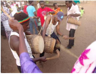
Fig. 1 : Paire de biñjuŋ juŋ ɓaparam