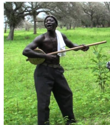
Un homme jouant avec son ekonting.

ou en bambou ( Oxytenanthera Abyssinica ) le long duquel cheminent trois cordes ou file de pêche.