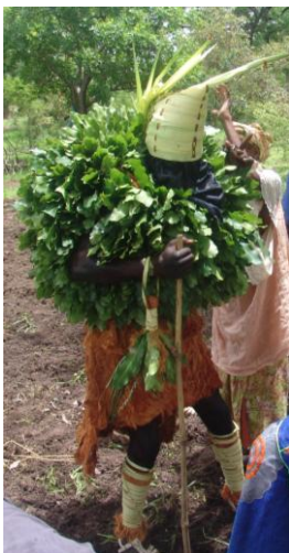
*Image d'un masque qui danse le Ikirman

Cette flute est généralement utilisée pour faire danser un masque appelé Šambumbu par les hommes et Camra ou Thiamra par les femmes (masque qui vient pendant les travaux ou corvées champêtres entre juillet et aout surtout). Cette danse s'effectue en générale pendant la nuit avec les femmes une fois de retour au village après une corvée.