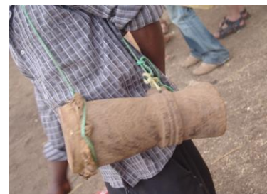
Fig. 3 : Samburuŋ

C'est le tam-tam avec lequel on commence la sonorité. C'est lui qui marque le départ de la danse, il permet de cantonner la mélodie. Le Samburuŋ appartient à la famille des Camara. Il produit un son léger et sa résonance peut aller très loin. C'est d'ailleurs la raison pour laquelle on l'utilisait pour annoncer un décès aux villages environnants du village d'Ethiowar.