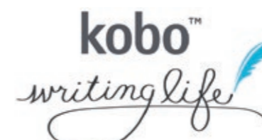
Le bandeau « Kobo writing life » 12

L'articulation des deux cultures (imprimé, numérique) peut prendre des formes variées. Si la Fnac, partenaire de l'entreprise Kobo, recourt à une imagerie classique (le vieux livre, la nouvelle de Daudet soutenant la liseuse), la start-up Readmill intègre le smartphone dans la panoplie des outils du bibliophile. En termes techniques et sémiotiques, on peut dire qu'il devient un élément de la chaîne paradigmatique de la culture imprimée. Le smartphone commence à faire partie de l' environnement du lecteur, c'est-à-dire de son univers de sens à partir duquel il peut agir sur le monde. D'autres formes d'articulation (autres que la subordination et l' inclusion ) existent : l'équivalence (écrire à partir d'une tablette ou avec un stylo reviendrait au même), la coordination (les icônes stéréotypées des deux cultures sont mises sur le même plan visuel), l' inversion (le smartphone est considérablement mis en avant et inclut la culture imprimée).