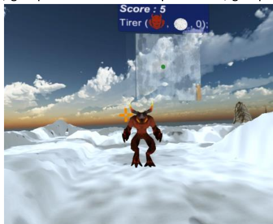
Figure 2. Capture d'écran de l'environnement virtuel "Think and Shoot"

La méthode expérimentale nous semblait la plus adaptée pour répondre à l'objectif précité dans la mesure où elle nous permettait d'identifier précisément quels facteurs intrinsèques à un dispositif immersif (e.g., champ de vision) et/ou propres à l'interaction avec l'EVI (e.g., flow) ont des effets sur l'UX. L'expérimentation a été menée auprès de 152 participants (28 femmes et 124 hommes) regroupés en six groupes expérimentaux (i.e., groupe variation du niveau d'interactivité, groupe variation du champ de vision, groupe variation du feedback du contenu 3D, groupe variation de la fréquence d'image, groupe expérience précédente avec les technologies 3D, groupe absence d'expérience précédente avec les technologies 3D). L'environnement virtuel immersif utilisé était « Think and Shoot » (créé avec l'outil de développement UNITY© pour le casque de réalité virtuelle Oculus©). La tâche consistait à tirer sur des créatures avant que celles-ci ne touchent le participant tout en respectant les instructions (e.g., tirer la créature de glace avec la balle de feu pour l'éliminer) données dans l'environnement virtuel en pseudo langage de programmation (Figure 2). Suite à la réalisation de cette tâche, les participants devaient compléter le questionnaire d'UX des IHEVI (cf. Tcha-Tokey et al., 2016). L'expérimentation complète durait de 30 minutes à 1 heure.