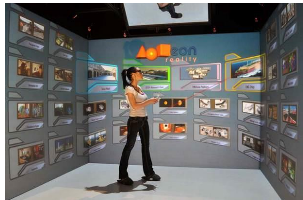
Figure 4. iCube (salle immersive de réalité virtuelle) de l'entreprise EON REALITY

Les premiers résultats statistiques (i.e., tests de Student) suggèrent une différence significative entre les deux périphériques. Ils révèlent une meilleure UX dans la salle immersive comparativement à celle perçue avec le casque de réalité virtuelle mobile. Ces résultats illustrent un exemple d'utilisation de notre questionnaire d'UX, vu comme une aide à la conception des IHEVI. Ici, le questionnaire a permis d'aider les concepteurs non seulement dans le choix d'un périphérique de réalité virtuelle pour une application ludo-éducative historique (la salle immersive semble mieux adaptée), mais aussi dans l'identification des composants à améliorer s'ils souhaitent toutefois opter pour le casque de réalité virtuelle mobile (e.g., réduire la vitesse des mouvements en avant pour une réduire les conséquences de l'expérience néfastes). Cette étude a fait l'objet d'une publication soumise dans une conférence internationale.