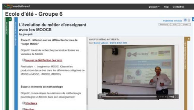
Fig. 2. L'interface de MediaThread

Les outils proposés afin de prendre des notes puis de les réutiliser sont les suivants. COCoNotes Live 1 (Fig. 1) est un outil (développé par notre équipe) de microblogging privé, consistant en une interface Web liée à un serveur. Il permet de classer les notes - soit par catégories prédéfinies, soit par des catégories définies par l'utilisateur - ainsi que de synchroniser les notes avec l'enregistrement de l'événement. Mediathread 2 (Fig. 2) est une plateforme open-source permettant d'écrire des textes liés à des