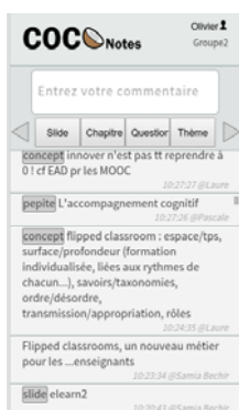
Fig. 1. L'interface de COCoNotes Live