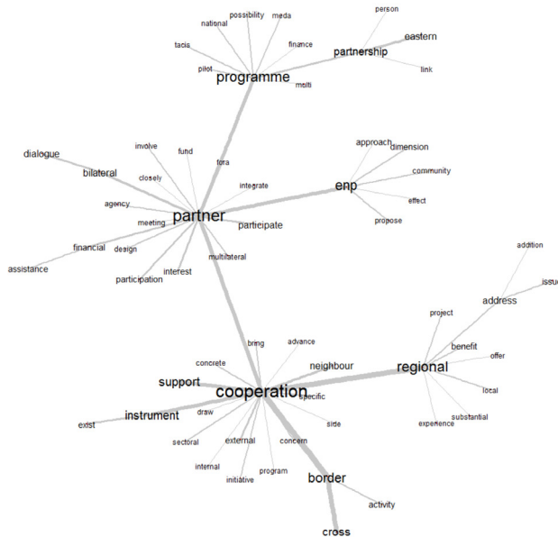
Figure 1. Univers lexical associés aux modalités de fonctionnement de la PEV

Le vocabulaire utilisé pour mettre en mots la politique de voisinage à intervalles de temps réguliers met en évidence des univers lexicaux qui se dessinent autour de notions-clés. L'analyse des communications-cadres de 2003 à 2013 révèle une grande diversité des mondes lexicaux en lien avec la désignation des entités spatiales. Plusieurs méthodes peuvent être utilisées pour étudier ces univers : fixer un objet spatial (région, nation) et interpréter son contexte d'utilisation, ou partir d'un des univers lexicaux qui émergent du corpus 3 et interpréter les proximités autour de notions qui paraissent pertinentes. Les graphes de similitude (figures 1 et 2) illustrent la configuration de deux mondes lexicaux associés, l'un autour des modalités de fonctionnement et d'action de la PEV (figure 1), l'autre autour des pays éligibles à la PEV (figure 2).