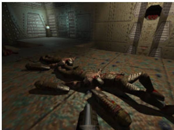
▲ Capture d'écran du jeu Quake ... après le massacre

Cette sociabilité donne lieu, dans ses formes les plus organisées, à la formation d'équipes qui s'affrontent à l'occasion de tournois nationaux et internationaux réunissant des milliers de participants. Des clans affichent sur des sites Internet les valeurs viriles aux noms desquelles leurs membres sont allés au combat, ont remporté la victoire, ou se sont fait éclater en menus morceaux par des adversaires dont la renommée satisfait à