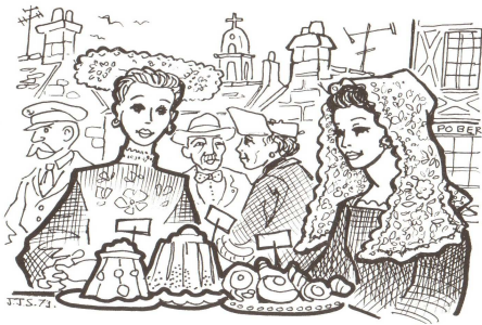
chez le marchand

1. C'est votre tour maintenant, je crois. Que voulez-vous? — 72