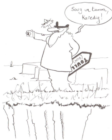
PROBLEME : c'est un mot utilisé à toutes les sauces en français. Kaout an dizober eus mell bec'h...

Pajenn 121 e weler ur paotr a ziskouezh implij ur benveg luc'hskeudenniñ war vord ar mor, hag a lavar da unan bennak ha ne weler ket : «Souz un tamm, karedig». O c'hoarzhiñ emañ ar paotr, laouen, hag eñ o kuzhat ur skritell a lavar «toull (don) ». Diouzh ul lennadenn hetero, ez eus neuze ur vaouez ouzhpenn da gontañ. Resisoc'h vefe neuze kontañ evit al levr a-bezh ur vaouezh o kanañ “Jezuz pegen bras eo”, div o tevel hag unan all a zo o paouez bezañ lazhet gant unan a ra “karedig” anezhi. Merc'hed yaouank c'hoant bras ganeoc'h komz ha deskiñ ar yezh, setu ar plas e vo dav deoc'h ober ho mad gantañ? Bruderezh al levr a embann fraezh: “Le guide du bretonnant propose, non sans humour , un regard sur la langue bretonne différent des autres ouvrages”.