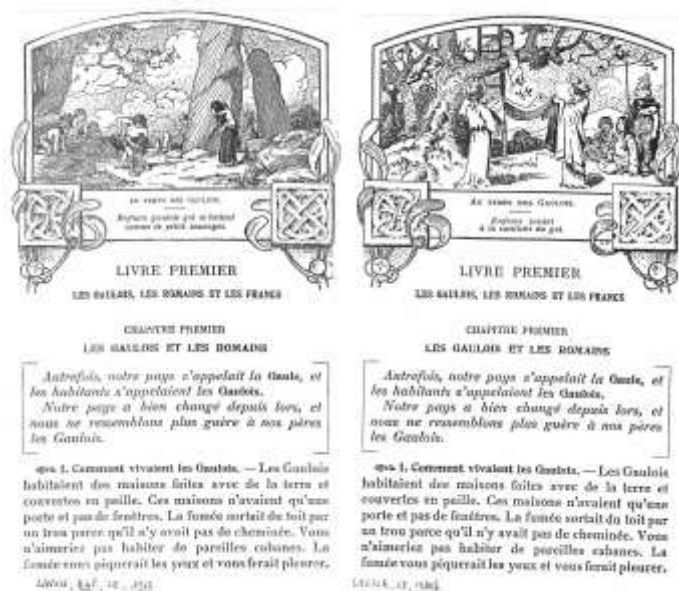
Images inaugurales du Livre I du petit Lavisse cours élémentaire « Au temps des Gaulois », 1913/1930

L'éditeur Armand Colin va en tirer les conséquences et opérer un changement de nature dans l'écriture des petits Lavisse. On le constate aussi bien dans les images qui inaugurent les grandes parties comme dans les textes des dernières leçons. Lavisse étant mort en 1922, l'éditeur, sensible à l'esprit briandiste de la fin des années 1920 – qui va bien au-delà des seuls maîtres syndiqués – modifie donc en profondeur les petits Lavisse. Pour le cours élémentaire cela se traduit par le changement des gravures d'en-tête de quatre des sept livres de l'ouvrage (représentant des scènes enfantines de jeu impliquant les petits lecteurs) lorsqu'elles étaient trop guerrières. Ces images inaugurales avaient un rôle d'identification considérable pour les enfants car elles les intégraient par le jeu à l'Histoire. Les images en général étaient au cœur de la méthode des petits Lavisse, comme Lavisse le souligne lui-même dans la première ligne de la préface de son cours élémentaire en 1913 : « Ce volume contient des récits qui encadrent des images ». Or, désormais les enfants gaulois ne « se battent plus comme des petits sauvages » (1913) mais « jouent à la cueillette du gui » (1930), de même qu'« Au temps de la Révolution », les « enfants jouant à la guerre » (1913) sont remplacés par des « enfants jouant à ramener à Paris la famille royale » (1930)