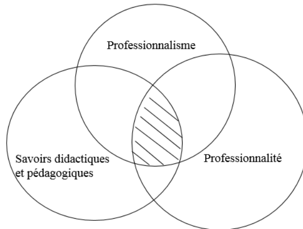
Figure 1 – Représentation synthétique de l'APE

Ces différentes définitions ouvrent plusieurs pistes de définition. Pour nous, l'autonomie professionnelle se situe au carrefour du professionnalisme, de la professionnalité et des compétences professionnelles ou savoirs didactiques et pédagogiques.