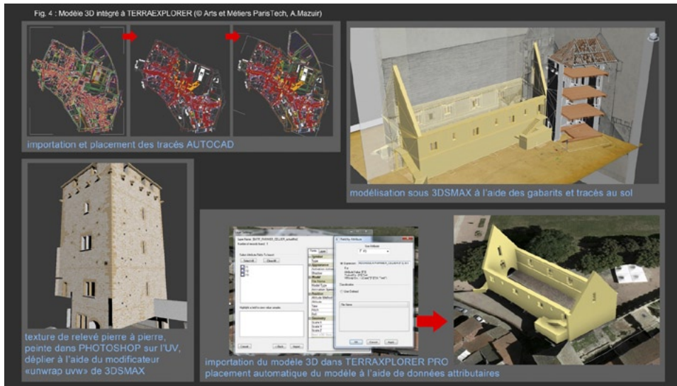
Fig. 4 – Modèle 3D intégré à TerraExplorer (Arts et Métiers ParisTech, A. Mazuir).