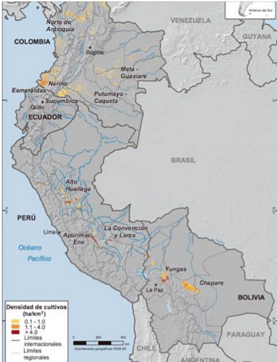
Carte 1. Zones de production de coca dans la région andine