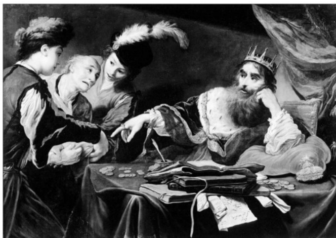
Claude Vignon (Tours, 1593 –Paris, 1670), Crésus recevant le tribut d'un paysan de Lydie , 1629, Tours, musée des Beaux-Arts.