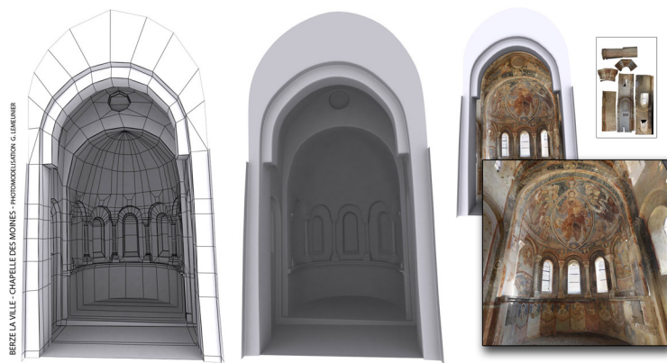
Berzé-la-Ville, la Chapelle-des-Moines, photomodélisation 3D.