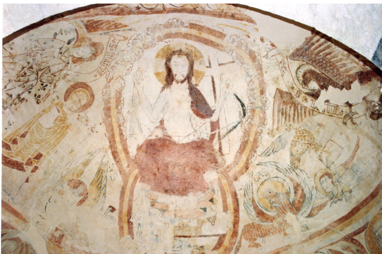
Burnand, église Saint-Nizier, vue de l'abside.