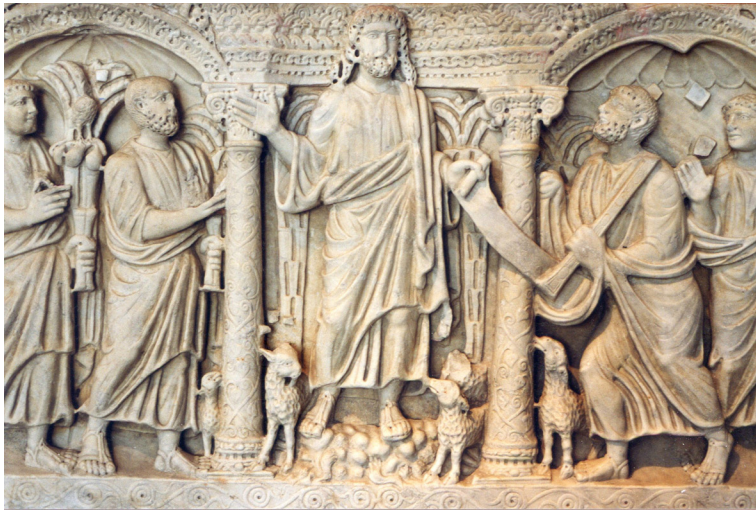
Musée de l'Arles antique, Sarcophage du Christ docteur.