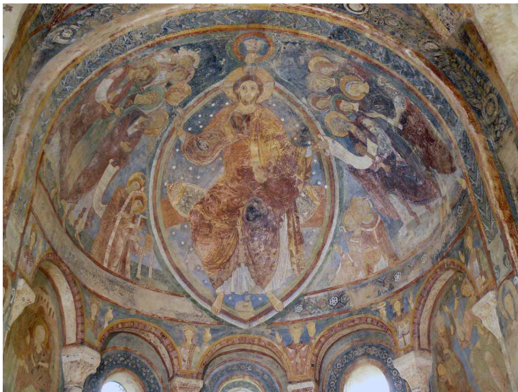
Berzé-la-Ville, la Chapelle-des-Moines, vue de l'abside.