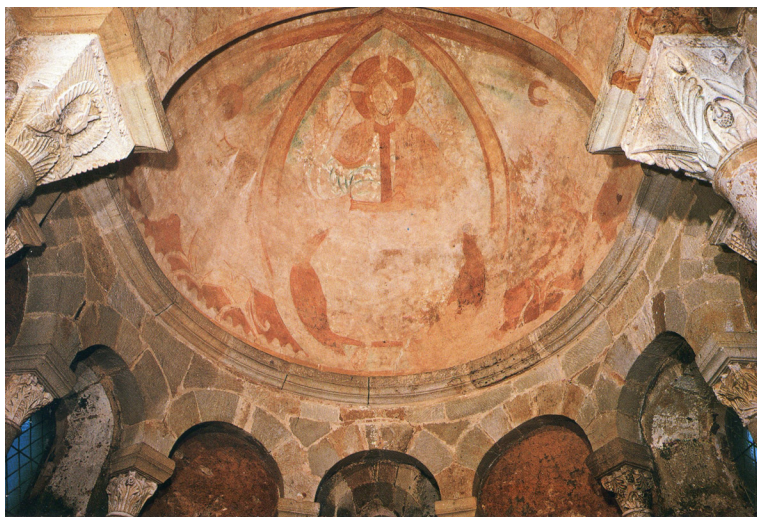
Autun, église Saint-Nicolas-lès-Marchaux.