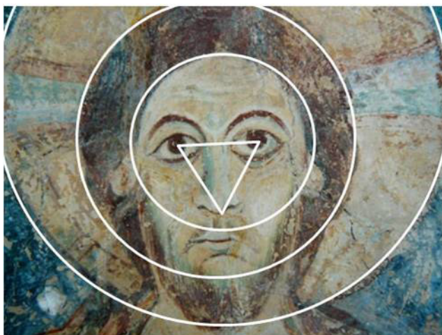
Berzé-la-Ville, la Chapelle-des-Moines, visage du Christ.