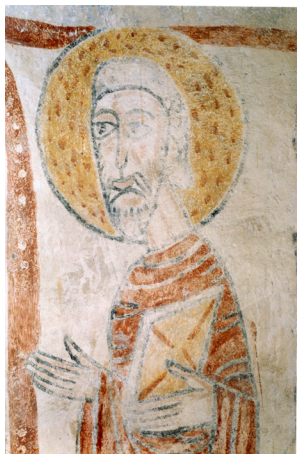
Burnand, église Saint-Nizier, détail d'un apôtre.