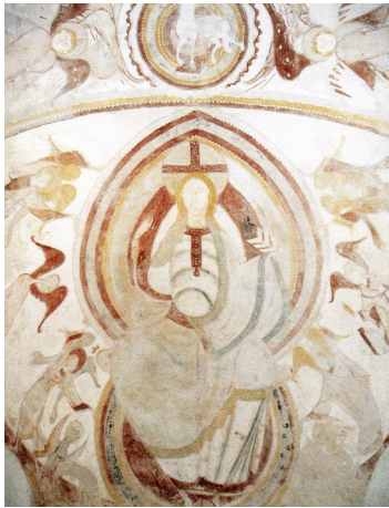
Montoire, église Saint-Gilles, abside centrale.