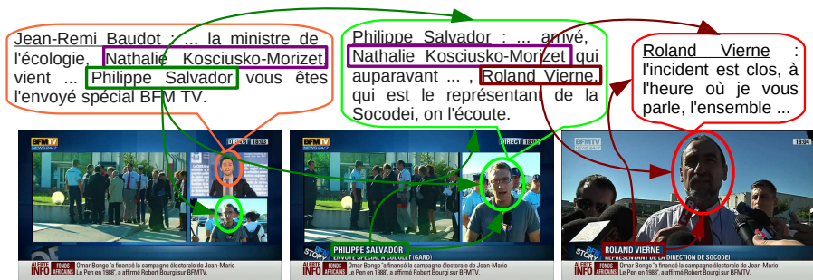
Figure 2. Noms prononcés et noms écrits pour le nommage des personnes

Plusieurs sources de noms sont issues d'annotations manuelles coûteuses, comme les sous-titres. Elles sont à écarter parce que c'est justement le coût d'annotation que nous voulons éviter. Par contre, deux autres sources intrinsèques aux flux télévisés sont disponibles : les noms prononcés dans la piste audio et les noms écrits en surimpression dans la piste image, en général dans un cartouche 3 . La figure 2 montre un extrait de journal télévisé avec le présentateur, un journaliste et une personne interviewée. Une corrélation est visible entre la prononciation ou l'écriture d'un nom et la présence auditive ou visuelle de cette personne.