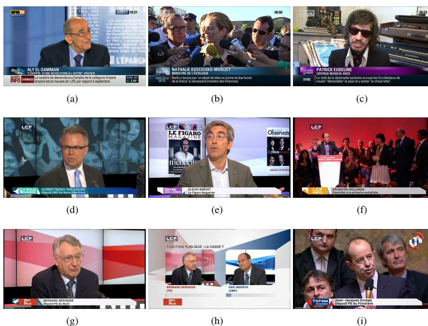
Figure 3. Exemples d'images du corpus REPERE

Sur le corpus phase 1, partie apprentissage, 724 personnes différentes ont été identifiées par leurs visages et 555 par leurs voix, pendant l'annotation manuelle. 1 907 des 11 703 occurrences de visages n'ont pas pu être identifiées ainsi que 255 locuteurs. Ces locuteurs correspondent à 25 minutes de temps de parole sur les 1 440 minutes annotées (466 tours de parole sur les 14 782). Pour la suite de l'article, nous ne nous intéressons qu'aux personnes qui ont pu être nommées pendant l'annotation.