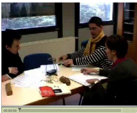
Figure 1 : cadrage des vidéo des préparations

vidéo. Chaque réunion de préparation a été filmée avec une caméra en grand angle placée dans un coin de la salle (Figure 1) ; Nous avons effectué des zooms pour conserver la trace de l'utilisation des documents Outils tout en sachant que nous perdions, dans le même temps, des informations sur le comportement des enseignants ;