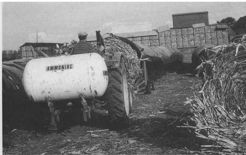
Traitement Armako : l'ammoniac est injecté au cœur des balles rondes à l'aide de fourches à dents creuses.

Les balles rondes ont été introduites dans la gaine de plastique à raison soit d'une balle par section (boudin classique, dans l'exploitation 2), soit de trois (2 au sol, 1 au-dessus), soit de cinq (3 au sol, 2 au-dessus) balles par section dans l'exploitation 1, respectivement en 1986 et 1987. Pour des raisons purement matérielles on a été amené, en 1987, chez l'exploitant 1, à conserver les balles par la méthode du tas. L'ammoniac avait alors été injecté par tuyau perforé à l'intérieur de la meule à la dose de 3,9 %.