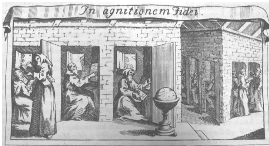
Document 3. Vignette de la lettre N, p. 197

Quels sont les ouvrages ainsi déposés, ou au contraire exclus, de l'espace public ? Bernard de Bologne propose une projection de la vocation capucine à travers 19 vignettes en tête des pages introductives de chaque lettre de son dictionnaire. Ces illustrations, réalisées par le dessinateur Octavio Toselli et le graveur Jean Fabbri, désignent de manière idéalisée les différents champs d'action publique de l'Ordre. Les religieux, en effet, sont presque toujours figurés dans un espace ouvert, et même les lieux conventuels sont conçus comme des décors de théâtre largement ouverts sur l'extérieur. Les occupations livresques sont figurées de manière particulièrement intéressante car la bibliothèque – est-ce une allégorie de celle de Bernard de Bologne ? – est ouverte sur un décor mi-urbain, mi-rural (Documents 3 et 4).