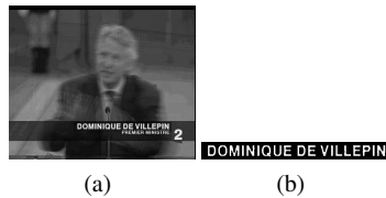
Figure 2. Images moyennes et binarisées

La reconnaissance du texte est effectuée toutes les 10 trames entre la trame d'apparition du texte et sa trame de disparition. Ces multiples détections nous permettent d'avoir plusieurs possibilités de retranscription de chacun des textes. Ces multiples possibilités sont fusionnées pour obtenir la transcription la plus probable.