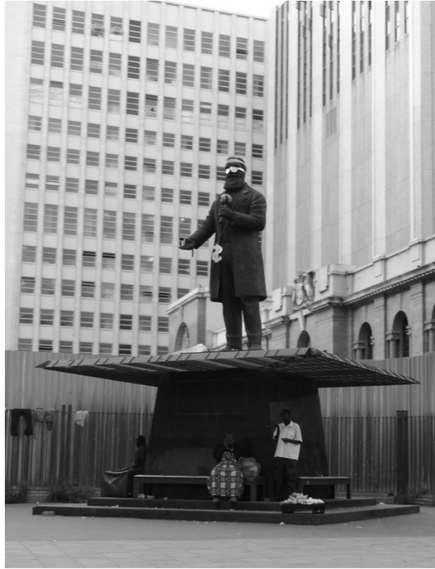
Figure 4

La figure du rappeur étant couramment associée à celle d'un jeune homme noir, ce détournement conduit à « africaniser » et à rajeunir CVB, tout en réaffirmant sa masculinité. Le dollar, quant à lui, souligne d'une part une certaine américanisation de la société contemporaine, mondialisant par la même occasion le personnage de CVB, mais contribue d'autre part à l'ancrer localement, Johannesburg étant historiquement la ville de l'or – ce qui est rappelé par l'emploi de la couleur dorée. Ce détournement n'est pas sans évoquer d'autres interventions artistiques réalisées en Afrique du Sud, par exemple la transformation de Louis Botha, premier Premier ministre afrikaner de l'Union d'Afrique du Sud, en initié xhosa 9 au Cap par B. Bailey (Minty, 2006 ; Houssay-Holzschuch, 2010) ou l'intervention de T. Rose à Oudtschoorn, consistant à entourer un monument en l'honneur de la police de laine de dollies , poupées caractéristiques de l'intérieur afrikaner (Houssay-Holzschuch, 2010 ; Marschall, 2010b). Tous ces détournements ont en commun de révéler la « dissonance patrimoniale »