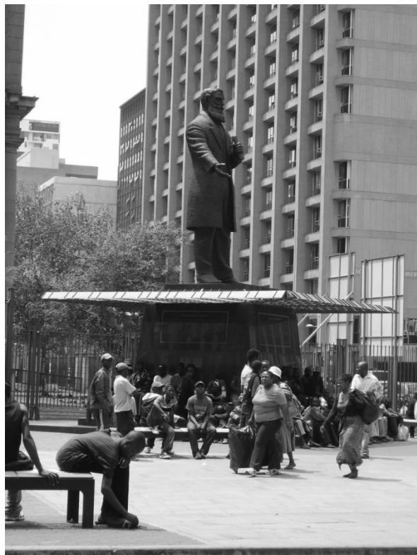
Figure 2 - © P. Guinard, février 2009

L'idée de l'architecte concernant la statue était, selon ses propres mots :