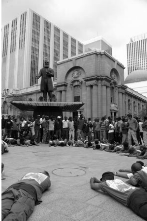
Figure 3

La statue ne servait pas seulement de décor à la performance, mais en constituait un élément à part entière. Tous les participants portaient des T-shirts sur lesquels figurait la statue de CVB transformée en une femme-arbre noire, à l'image d'Ingrid Mwangi, censée symboliser la mère-nature, protectrice et nourricière. Le changement de sexe et de couleur de la statue contribuait à faire de CVB le représentant des populations (anciennement) dominées, et non plus dominantes, alors que la métaphore maternelle et végétale participait à une certaine infantilisation des migrants. La statue, ou du moins son image, était ainsi détournée et appropriée par les artistes, en vue d'une revendication sociale et politique (faite au nom, voire à la place des intéressés) : la nécessité d'accueillir et d'aider les nécessiteux, et particulièrement les migrants, message particulièrement sensible dans un contexte de forte xénophobie. A cet égard, la force de la performance a sans doute résidé dans le fait que, au fur et à mesure que les participants se relevaient, s'est instauré un dialogue, plus ou moins véhément, des migrants aussi bien avec les artistes, qu'avec les passants sud-africains.