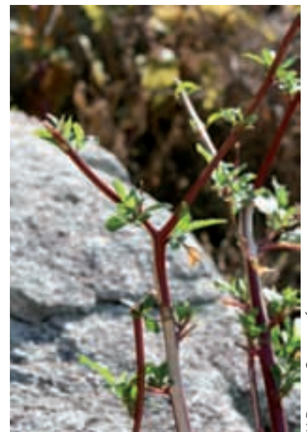
Y. Dumas, Cemagref

Cette espèce manifeste également une forte toxicité envers les mollusques (propriétés molluscicides). Aldea et al. (2005) évaluent en effet à 150 mg/l la dose efficace de poudre de baies sèches de Phytolacca americana dans l'eau pour intoxiquer des espèces invasives d'escargots dans un bassin aquacole (75 % de la population est détruite au bout de 30 jours). Si l'on prend pour exemple l'individu (I1) étudié par Dumas en 2008 (données non publiées) qui a produit 242 g de fruits secs, il serait capable à lui seul d'intoxiquer 1 613 litres d'eau à une concentration létale pour ces gastéropodes. De tels niveaux de toxicité contribuent à expliquer le développement de cette espèce à l'échelle de notre territoire. Pas très étonnant dans ces conditions que Campana et al. (2002) évoquent la