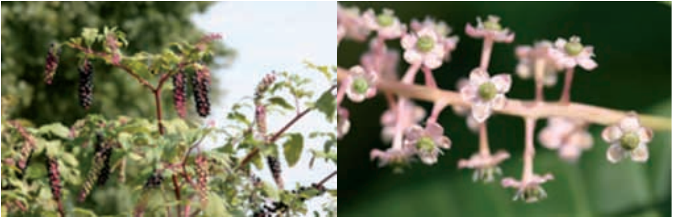
(1) Plante en début de fructification et (2) fleurs pédicellées formant un racème (Jassans-Riottier (01) – 2008)