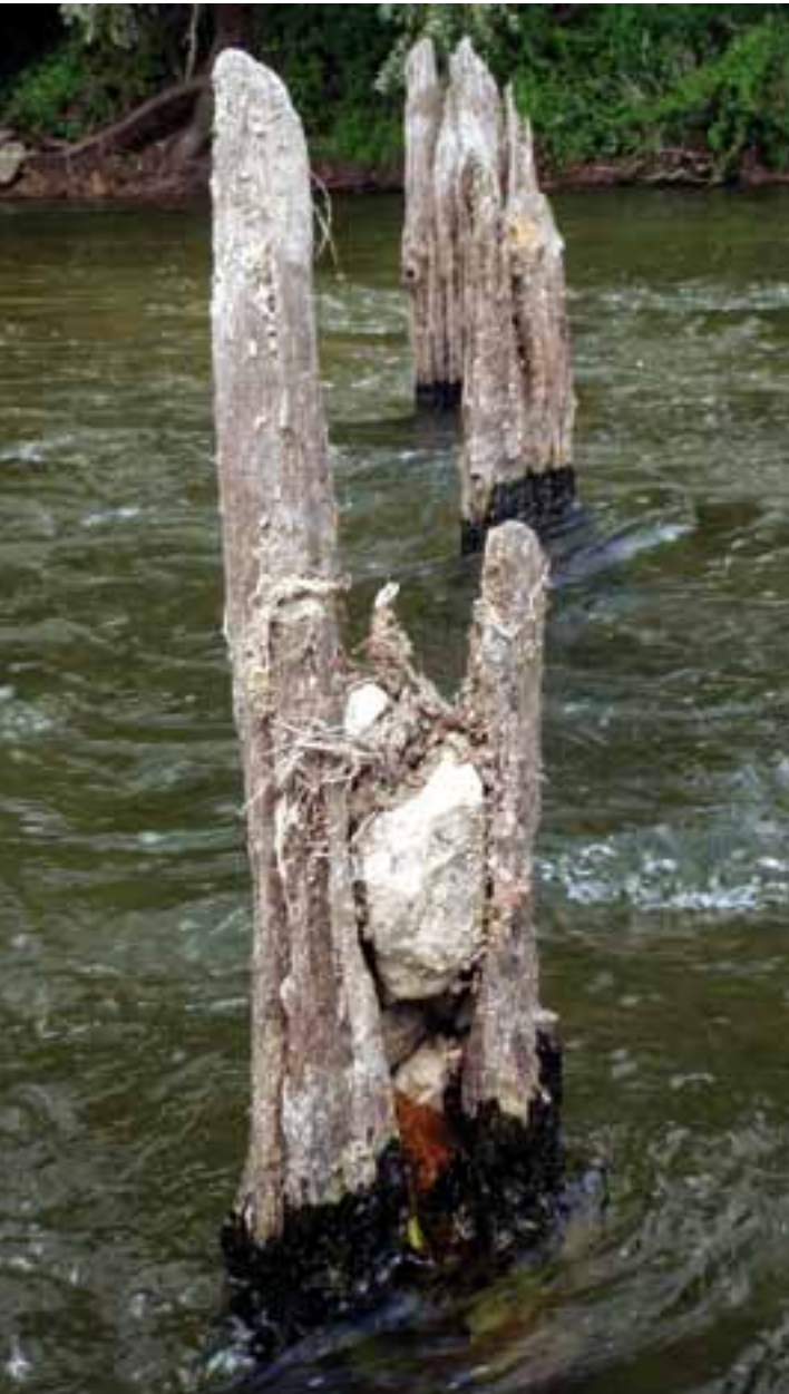
Photo 1 : Un pieu de fondation du pont médiéval de La Charité-sur-Loire très érodé ; en période de crue, le fleuve a incrusté des galets dans le bois, rendant difficile tout prélèvement.

Photo 1: A severely eroded foundation pile belonging to the medieval bridge at La Charité-sur-Loire; during flood episodes, the river embedded stones in the wood making any sampling difficult to achieve.