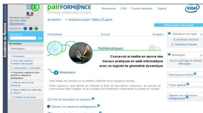
Figure 2. Le parcours TPGéom, étape 4.

Le travail prévu lors de la formation propose la réalisation, par chaque équipe de stagiaires, d'une séquence de classe qui sera testée par un ou plusieurs membres de l'équipe. Il alterne des périodes en présence (trois journées) et à distance (étalées sur treize semaines, hors vacances scolaires). Le principe même de la formation est donc tourné vers le travail documentaire collectif, qui est vu ici à la fois comme un moyen et un objectif de formation. Des temps de formation en présence permettent un travail à l'intérieur des équipes, ainsi que des échanges entre équipes. Pour faciliter la communication, à l'interne et à l'externe, un modèle commun de description de séquences de classe est proposé, il peut être modifié au cours de la formation en fonction des propositions des stagiaires. Il constitue une ressource essentielle pour qu'un stagiaire, ou une équipe, puisse formuler ou comprendre des propositions. Ce modèle comporte des rubriques spécifiques à la mise en œuvre d'une démarche expérimentale ; ainsi l'emploi même de cette ressource, dans un mouvement d'instrumentation, amène les stagiaires à développer une vigilance particulière à l'égard de cette démarche.