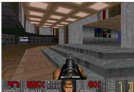
Doom (capture d'écran)

Ainsi, le joueur, qu'il soit fille ou garçon, est invité à devenir le héros du jeu, un homme dès plus virils. Seul contre tous, ce soldat d'élite, surarmé, blesse, tue, est blessé et parfois tué. Au royaume des stéréotypes, il est ce qui se fait de mieux !