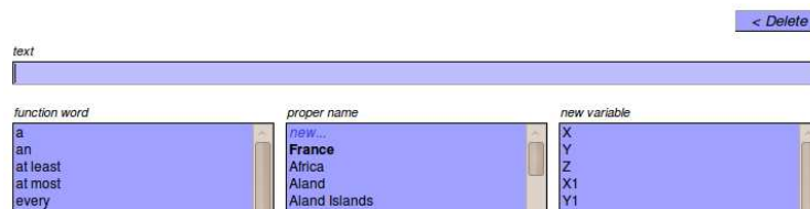
FIG. 4 – L'éditeur prédictif de Acewiki.

À l'opposé, Semantic Mediawiki (Völkel et al., 2006) est très représentatif de l'approche wikis for ontologies , et est celui qui se rapproche le plus de la philosophie Wiki. C'est une extension de MediaWiki , le moteur utilisé par Wikipédia. Afin de conserver une syntaxe simple, il intègre l'édition des triplets RDF dans son wikitext (voir figure 3). Il permet ainsi aisément la création de liens typés qui servent également à indiquer les attributs de la page. Un autre intérêt de Semantic MediaWiki est la forte communauté de développeurs qui l'entoure et produit de nombreuses extensions, telles que les formulaires de saisie, l'ajout d'un moteur d'inférences, etc. Le site institutionnel de MediaWiki 6 en recense 31. En particulier, l'extension Halo 7 propose des formulaires, de l'auto-complétion, un éditeur WYSIWYG, l'intégration de fichiers audios ou vidéos mais aussi l'intégration d'un point d'accès SPARQL. Cette communauté fait de Semantic MediaWiki le projet le plus actif et le mieux documenté.