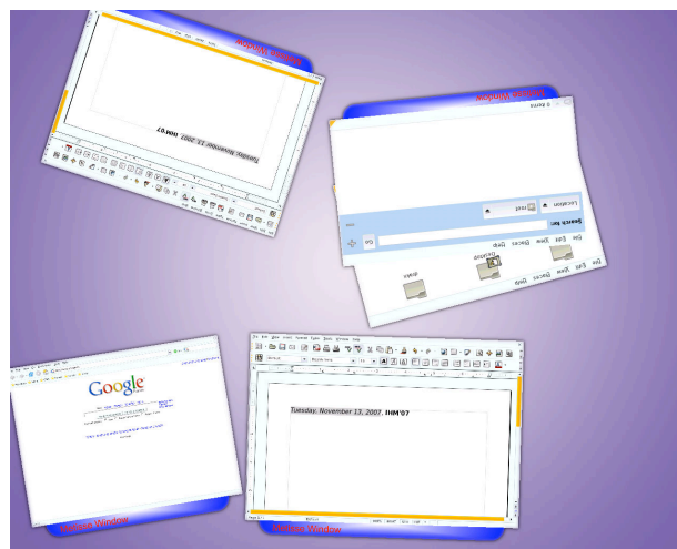
Figure 2 : Plusieurs applications existantes (Firefox, Nautilus et OpenOffice) ouvertes par deux utilisateurs. Le document OpenOffice est partagé.

Le serveur X de Metisse rend accessible les images des fenêtres par une connexion réseau. Nous avons donc implémenté un module client pour DiamondSpin [10], une boîte à outils open-source pour table interactive. Du point de vue du serveur Metisse, notre module est un compositeur qui va récupérer les images des fenêtres et générer des événements clavier et souris. Le protocole de communication entre le serveur Metisse et le compositeur est dérivé du protocole RFB : les mises à jour des fenêtres (on ne pas seulement du Frame Buffer) sont envoyées sous la forme d'images rectangulaires correspondants à la plus petite zone englobant la modification. Ces images sont récupérées et stockées par DiamondSpin dans des textures OpenGL, qui les positionne ensuite de manière appropriée par rapport aux utilisateurs (orientées dans le sens de lecture de l'utilisateur qui manipule la fenêtre, ...) et les affiche sur la table.