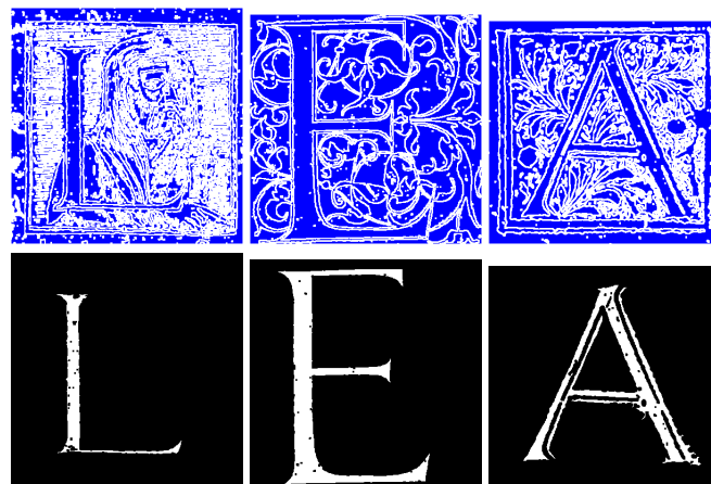
FIGURE 2 – Exemples de lettres extraites automatiquement à partir des lettrines

Il existe un grand nombre de motifs 3x3 possibles dans une image en niveaux de gris. L'idée est donc d'appliquer