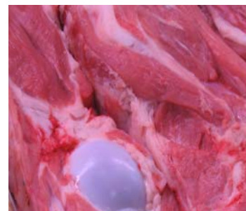
La motivation religieuse n'est pas l'unique déterminant de la consommation de viande halal

res, qu'elle est meilleure pour la santé et que le procédé d'abattage halal est moins pénible pour l'animal.