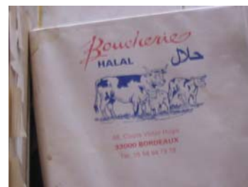
Le boucher n'est plus comme autrefois le principal garant de la licéité de la viande

fiance des consommateurs. Est-ce en raison du lien qu'elles entretiennent avec les pouvoirs publics ? Ces derniers en effet sont, après les médias, ceux qui accumulent le plus de méfiance de la part des consommateurs.