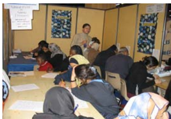
Quatre jours d'enquête dans un stand loué à l'UOIF en Mars 2005

Avant de présenter ces premiers résultats, quelques remarques préliminaires sur les limites d'une telle enquête :