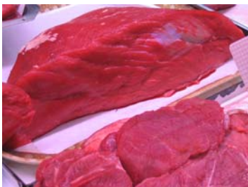
Pour les personnes interrogées, la viande halal a meilleur goût que la viande non halal.