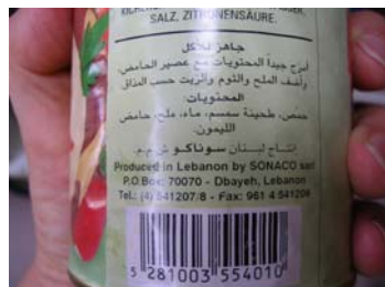
Seulement un tiers des personnes interrogées pense que l'information sur les produits halal est suffisante.

les personnes interrogées estiment qu'elles peuvent se procurer « facilement » ces produits. Toutefois seulement un tiers des personnes interrogées pense que l'information sur les produits halal est suffisante.