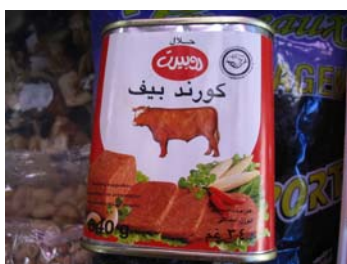
Pâté de viande halal provenant du Brésil Boucherie halal Bordeaux