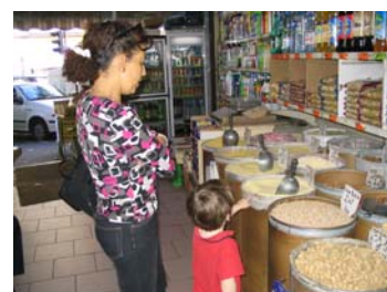
Les consommateurs devraient prendre leur part de responsabilité.

Les consommateurs attendent beaucoup des produits halal : sécurité, qualité, nutrition. Mais se donnent-ils les moyens de leurs exigences ?