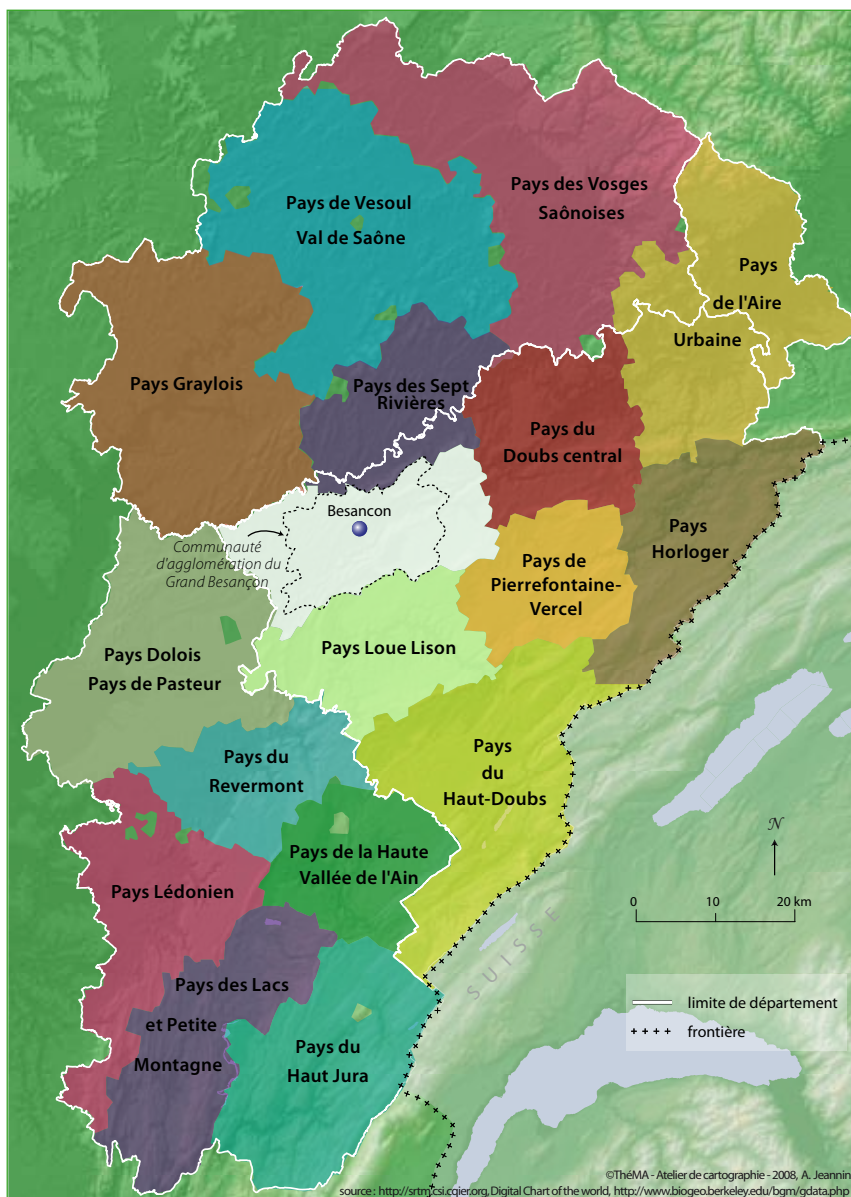
Figure 1 : les Pays en Franche-Comté

Pour autant, cette superposition de territoires n'est pas sans inconvénient dès lors que la Ligne à Grande vitesse (LGV) Rhin-Rhône tangente la CAGB et que l'implantation de la gare TGV de l'ag-