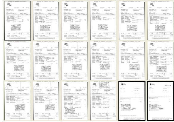
FIGURE 2 – Classification assistée. Les documents sont triés par similarité décroissante. La première image encadrée en gris est l' image de référence . Les deux images encadrées en noir ont été sélectionnées par l'utilisateur car elle n'appartiennent pas à la même classe.

Le tableau 2 récapitule les résultats obtenus lors de la classification de 4 bases d'images de documents de type "ressources