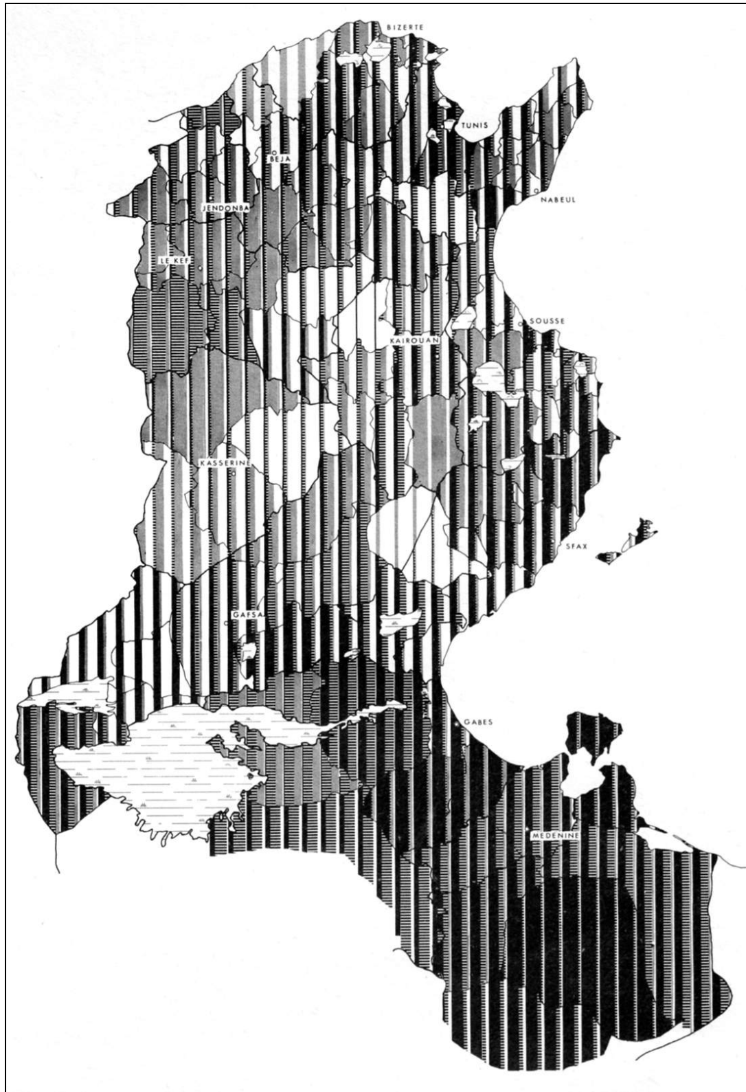
FIG. 4. - Attraction des régions françaises sur l'émigration tunisienne.