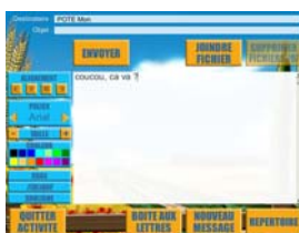
Figure 3 : outil de messagerie électronique