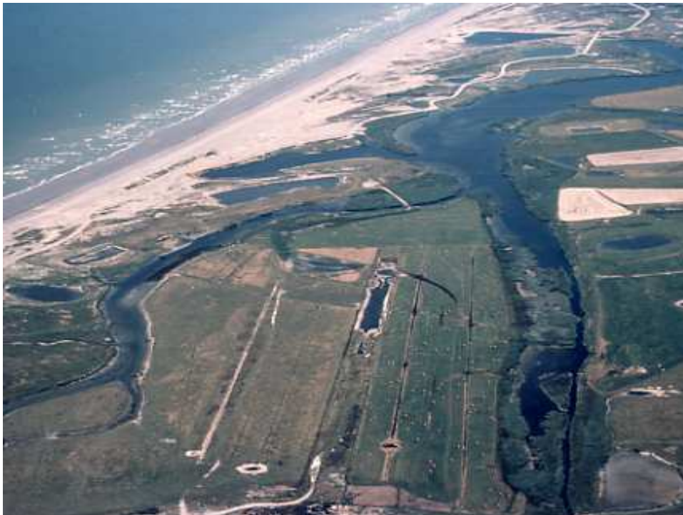
Document 4 : vue aérienne des Bas-champs, avec le Hâble d'Ault, ancienne lagune aujourd'hui en réserve de chasse, et des zones humides appartenant au Conservatoire du Littoral.

Les joyaux naturels des Bas-champs (document 4) sont représentés par des espèces d'oiseaux rares au niveau national, voire européen, inscrites à l'annexe 2 de la convention de Berne et qui trouvent ici l'un des rares sites de reproduction régional : Butor étoilé ( Botaurus stellaris ), Grand gravelot et Gravelot à collier interrompu ( Charadrius hiaticula et C. alexandrinus ), Panure à moustaches ( Panurus biarmicus ). Il en est de même pour les plantes : citons, parmi les espèces rares et protégées : le Gazon d'Olympe ( Armeria maritima ), la Litorelle des étangs ( Littorella lacustris ), l'Orchis ignoré ( Dactylorhiza praetermissa )...et le Chou maritime ( Crambe maritima ). Il est intéressant de noter que toutes les stations de plantes rares sont situées au nord de la D 102 qui relie Cayeux à Brutelles, soit dans la zone la moins directement menacée d'inondations.