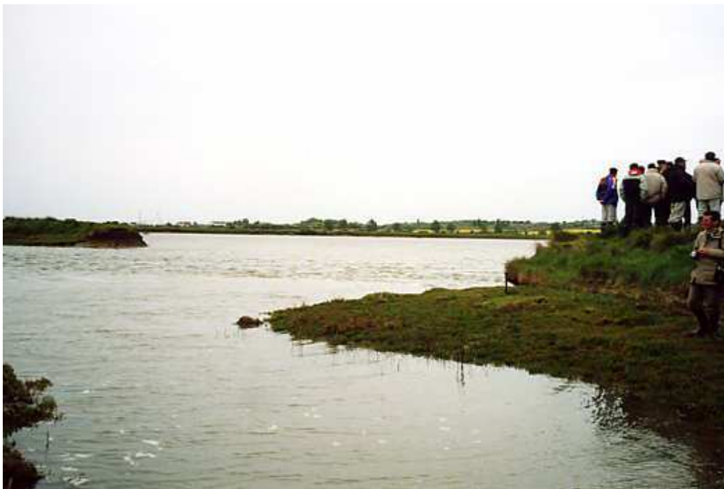
Document 1 : Site dépoldérisé de Tollesbury (Essex, Angleterre) : des visiteurs sur la digue, près de la brèche laissant revenir l'eau de mer (photo : V. Bawedin, mai 2003).

Ces deux exemples anglais montrent l'attention portée par les pouvoirs publics aux phénomènes de lutte contre l'élévation du niveau de la mer, d'une part, de protection de l'environnement d'autre part, les deux étant ici complémentaires. Cela traduit une anticipation, une vue à long terme dont ces travaux sont la résultante, fait relativement rare quand il s'agit de gestion du littoral.