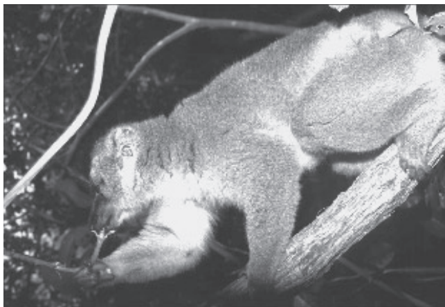
Figure 2.– Les makis ( Eulemur fulvus mayottensis ) introduits en 1997 sur l'îlot Mbouzi, consommaient, en novembre 2000, les nouvelles tiges de Dioscorea sansibarensis.

Pour favoriser cette évolution, il a été décidé de restaurer la végétation sur une colline proche du refuge, où des cultures abandonnées avaient laissé un paysage dévasté. Ainsi, les services de la Direction de l'Agriculture et de la Forêt ont planté des espèces locales utiles aux lémurs, notamment le tamarinier ( Tamarindus indica ) et le manguiier ( Mangifera indica ). Cependant, lorsque les fruits ont une valeur commerciale, ils attirent des « cueilleurs » venus en pirogue ; et le braconnage (tenrecs, roussettes et parfois lémuriens) demeure également un problème important. C'est pourquoi, avant de programmer une diminution progressive du nourrissage d'appoint des lémuriens, et si possible une suppression totale, il est obligatoire d'organiser un gardiennage efficace et permanent, ainsi que des campagnes de sensibilisation (deux activités complémentaires pour tout projet de conservation).