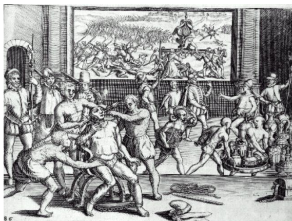
[Exécution d'Atahualpa, Las Casas, 15]