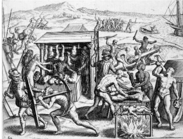
[Boucherie de chair humaine, Las Casas, 10]