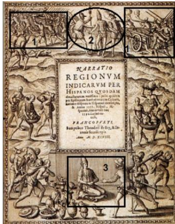
[Frontispice Las Casas]