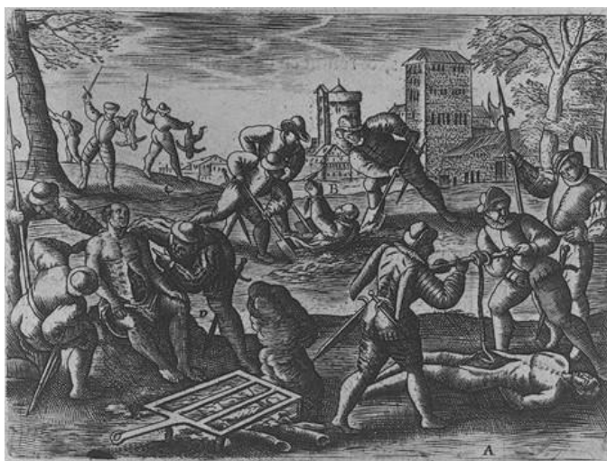
[Huguenots, en France, Pl. 13]

Cette planche illustre l'horreur perpétrée par les huguenots. Quatre scènes sont conjointement représentées, sans réel rapport entre elles, dans un cadre rappelant un encadrement religieux (l'édifice de l'arrière-plan présente des aspects de monastère). L'auteur a, semble-t-il, organisé sa démonstration, les lettres de l'image renvoyant à une explication textuelle. Trois huguenots, chiffre symbolique, s'acharnent sur un personnage dans chaque partie de l'image. A l'arrière-plan, des enfants sont exécutés, tenus d'une main par les pieds, l'autre brandissant une épée prête à s'abattre sur la pauvre victime, symbole de l'innocence. Les trois parts des premier et deuxième plans mettent en scène un religieux, qui est torturé par un trio de protestants. Dans la partie droite (A), il est éviscéré, ses intestins sont enroulés autour d'une broche, alors qu'à l'arrière (B), le religieux est enterré vivant, tandis que l'homme d'Eglise présente un objet indistinct, dernier rempart face à la fureur de ses agresseurs. Enfin, le plus visible sur la planche, sur la partie avant à gauche, les huguenots auscultent l'ecclésiastique, préalablement éventré après qu'il ait consommé une grande quantité d'eau, dans le but d'appréhender le fonctionnement de son estomac. Une grille chauffe sur un brasier, laissant imaginer la torture suivante : la grille est hérissée de pointes, qui, une fois chauffée jusqu'à devenir rouges, pénètrent le corps du malheureux.