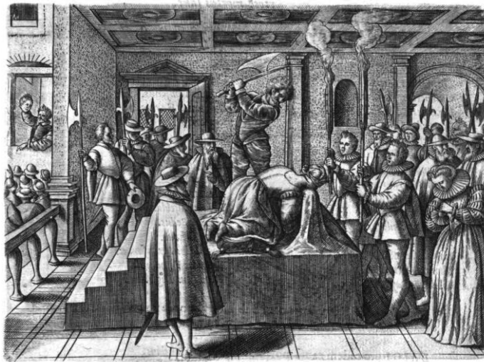
[Exécution de Mary Stuart]

texte d'autant plus précis dans la narration de l'horreur. Les illustrations concernant l'Angleterre peuvent être perçues comme une revanche pour l'auteur qui a dû fuir ce pays 36 . Une planche représente, par exemple, la décapitation du chancelier sous le règne de Henry VIII, Thomas Morus (More), chrétien ayant refusé de suivre le monarque lors de son rejet de Rome.