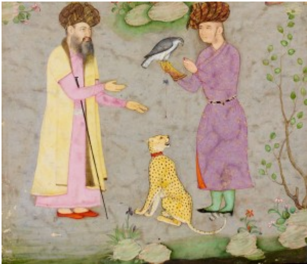
Fauconnier et guépard apprivoisé (dét.), Inde du Nord, c. 1610-1615, Londres, Victoria and Albert Museum, IS.48:37/B-195

Le guépard était entraîné à grimper à cheval et à chasser la gazelle avec beaucoup d'efficacité (trad. MIQUEL 1983, p. 405). Il était comparé au meilleur autour ou faucon de chasse que possédait le père d'Usāma. Un jour, le guépard réussit presque l'exploit de capturer deux lièvres à la fois : la gueule encore remplie du premier lièvre, il continua sa course, et en arrêta un deuxième en le frappant avec ses pattes, même si, ne pouvant le saisir, il dut le laisser s'échapper.