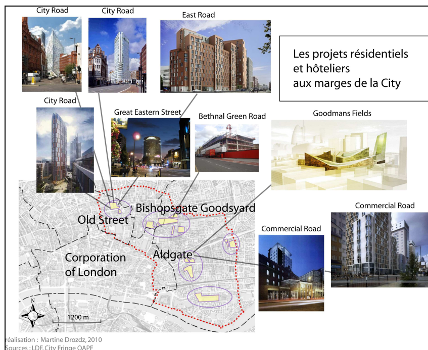
Fig.4 Nouveaux paysages résidentiels dans les franges nord-est de la City