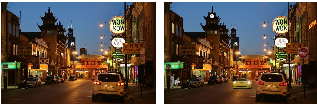
FIGURE 1. Initial and personal images

A.3.1. Description. — The user creates a personal image by interacting with an image initially displayed as illustrated in Figure 1. This image contains some particular regions where interactions are possible, hereafter named Gecu (Graphical Element Chosen by User).