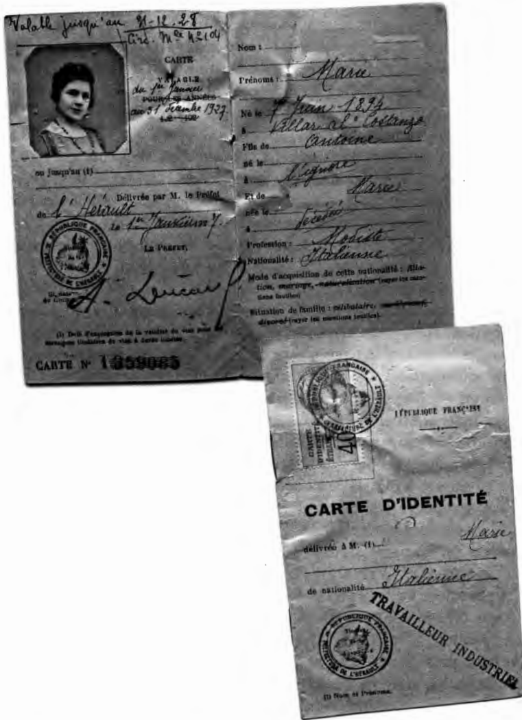
Figure 1 - Carte d'identité d'une étrangère délivrée en 1927, 3 pages sur 11.