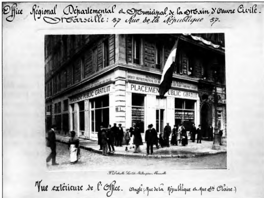
Figure 2 - L'Office régional, départemental et municipal de placement à Marseille, photographié par Fernand Detaille en 1919.

Les étrangers sont-ils nombreux à passer par le SMOE marseillais ? Des données relatives à 1924 et 1925 montrent que quelques centaines à quelques milliers d'étrangers passent par le service chaque semaine 33 . Les données n'étant pas sexuées, il est difficile de dire si les femmes étrangères arrivant par voie de mer y passent aussi. Dans les sources consultées, seul un rapport du commissaire spécial de Marseille informe de l'arrivée par le vapeur Ionie de « plusieurs familles arméniennes comprenant 347 têtes » dont le passeport a été visé en Bulgarie et qui ont été mises à disposition du SMOE. Les étrangers qui n'arrivent pas par voie de mer sont tenus de demander leur carte d'identité dans leur commune de résidence à leur arrivée qu'ils soient travailleurs ou non depuis le décret du 15 octobre 1924. À Marseille, c'est au commissariat de quartier que l'étranger doit réclamer sa carte. Dans le récit de l'immigration de sa famille arménienne à Marseille dans les années 1920 alors qu'il était enfant, le cinéaste Henri Verneuil (de son vrai nom Achod Malakian) raconte : « "Réfugié d'origine arménienne" telle était l'inscription manuscrite, face à la question imprimée "Nationalité", sur ces cartes d'identité pliées en accordéon que nous allions chercher dans les préfectures de