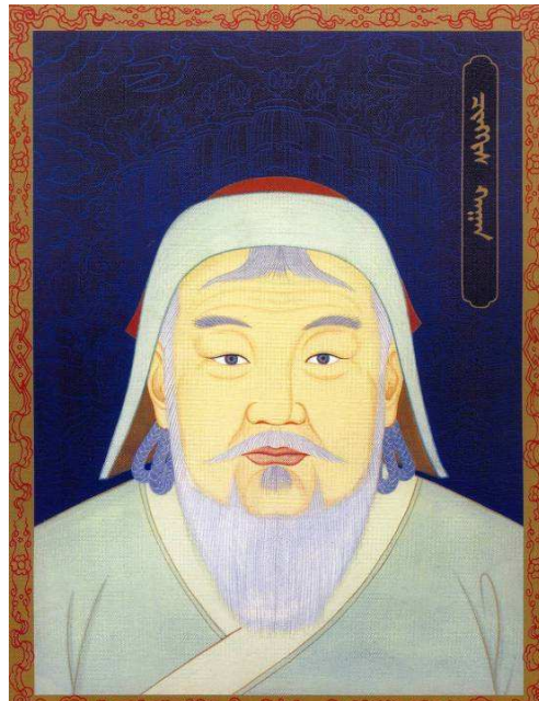
Fig. 10. Peinture moderne de Chinggis Khan, en buste, de face, par Tangadijn Mandir, peintre et membre de l'Académie de la Civilisation Nomade. Cette peinture est reprise avec de nombreuses variantes et est également répandue en Mongolie-Intérieure.

comme le dieu fondateur de la nation mongole. Dans les portraits où Chinggis Khan fait face au spectateur, l'attitude statique et hiératique ainsi que l'inexpressivité du visage contribuent à désincarner la figure, à lui conférer un caractère sacré ( fig. 8, fig. 11, fig. 14 ). Sur le portrait dessiné par Mandir ( fig. 10 ), Chinggis Khan porte une barbe arrondie, régulière, qui remonte jusqu'aux coins de la bouche, la touffe de cheveux est régularisée ; le vêtement croisé est le seul élément de dissymétrie 86 . Certaines compositions parfaitement hiérarchisées et ordonnées rappellent l'organisation des thangkas 87 ( fig. 20 ). Les ronde-bosses le figurent généralement de face, posture de l'icône culturelle ( fig. 1, fig. 4, fig. 17 ). Le portrait peut également être tourné en miroir par rapport au « portrait de Taipei », vers la gauche (si les Khans des « portraits de Taipei » regardaient vers la droite, c'était parce qu'ils étaient orientés vers leur épouse située à leur gauche).