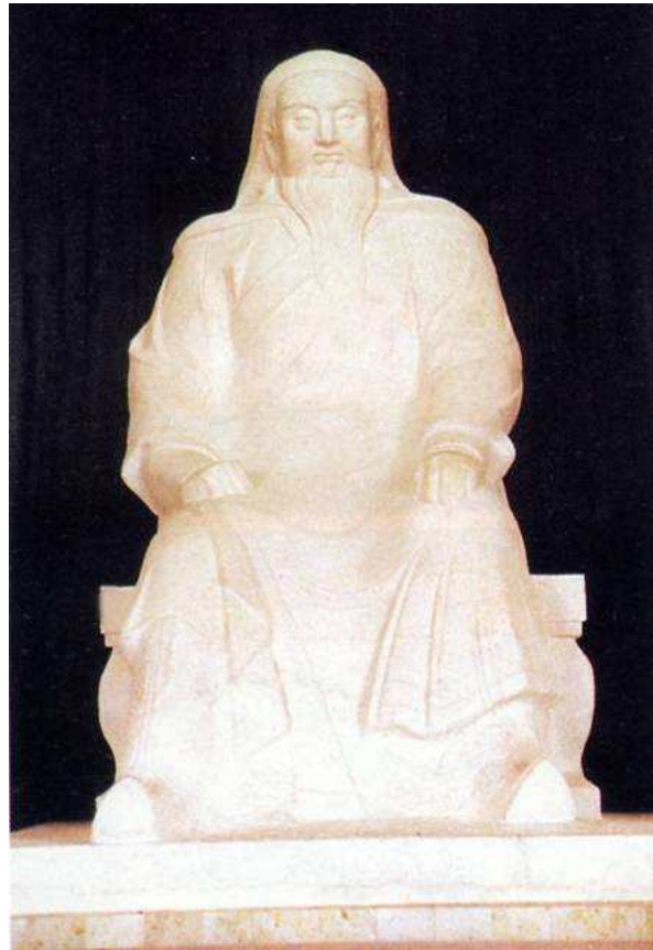
Fig. 22. Statue dans la salle centrale du « Mausolée » de Chinggis Khan dans les Ordos, qui a remplacé la précédente au début des années 1990.

Après la réhabilitation du grand Khan au début des années 1980, les artistes mongols ou Han durent répondre à de nombreuses commandes officielles pour restaurer et redécorer le « Mausolée » et le temple d'Ulanhot, ériger des statues dans les villes de Mongolie-Intérieure et illustrer des ouvrages sur la vie de Chinggis Khan 171 . Des statues furent érigées dans toute la Mongolie-Intérieure, mais également à Pékin et dans des grandes villes de Chine comme Chongqing au Sichuan 172 . Chinggis Khan est devenu partie intégrante de l'histoire chinoise.