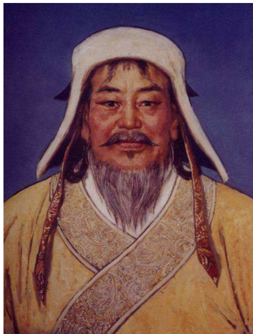
Fig. 24. Buste de Chinggis Khan de face, peinture à l'huile, environ 80 cm de haut, par Hou Yimin 侯一民, peintre mongol. © Hou Yimin