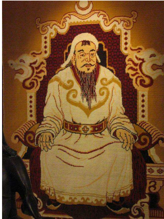
Fig. 15. Tapis mural mongol représentant Chinggis Khan sur un trône, entouré des signes du zodiaque et surmonté de son étendard blanc, mesurant plus de deux mètres de haut. Ces tapis sont produits en grand nombre par une fabrique mongole, et les Mongols suspendent fréquemment ces tapis aux murs de leur appartement ou de leur yourte.