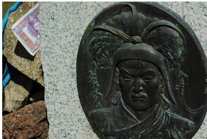
Fig. 11. Hurcgerel, stèle représentant Chinggis Khan, Cenher Mandal, Hentij. Cette stèle a été déménagée à quelques kilomètres du lac et remplacée par le monument créé par Ughtaabajar pour commémorer les 840 ans de la naissance de Chinggis Khan, qui fut inauguré le 29 août 2006.

marbre dans la yourte de réception située dans la cour du Palais du gouvernement ( fig. 4 ), et la statue de Chinggis Khan, debout, qui se dresse au centre de la ville d'Öndörhan, capitale de la province du Hentij 89 , ainsi que des projets non retenus de statues monumentales 90 sont d'autres exemples de statues iconiques. L'icône divinisée de l'ancêtre lointain, décontextualisée, est bien plus fréquente que le portrait du personnage historique. Si l'on excepte les scènes historiées 91 , qui ne seront pas traitées dans cet article, les représentations non iconiques sont rares ; quant à la caricature, elle est exceptionnelle et peu mordante ( fig. 12 ). En tant qu'icône, Chinggis Khan est figuré seul ; rares sont les images où il est accompagné d'Ögödei et de Khubilai ( fig. 1 ), ou de ses huit généraux (qui devraient être au nombre de neuf, chiffre sacré chez les Mongols) ( fig. 20 ).