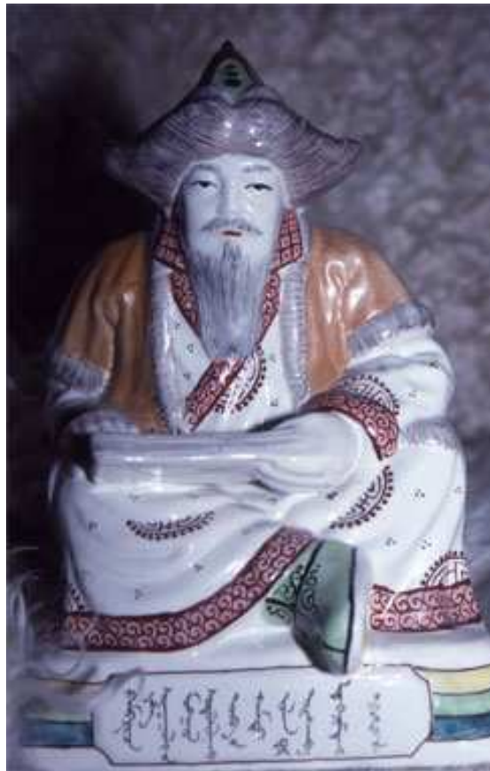
Fig. 18. Statuette assise en porcelaine de Chinggis Khan. L'acheteur choisit la maxime attribuée à Chinggis Khan à inscrire sur le livre qu'il tient dans les mains, et fait inscrire son nom et la date en bas de la statuette. Mongolie.