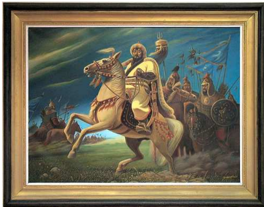
Fig. 9. Peinture représentant Chinggis Khan à cheval dans un hall de réception au Palais du gouvernement, Ulaanbaatar.

places urbaines 83 sont dans la tradition du portrait équestre européen dévolu à la glorification du pouvoir. L'immense statue de Conžin Boldog ( fig. 5 ) semble ici faire exception : toutefois l'empereur, hiératique sur son cheval à l'arrêt, ne porte ni arc ni flèche mais s'appuie sur un fouet doré 84 . Le cheval ne sert qu'à rehausser le Khan, à le rendre plus monumental encore. Sur une peinture narrative prenant modèle sur les portraits équestres de souverains européens exposée dans le Palais du gouvernement, Chinggis Khan mène son armée ; son cheval se cabre, l'étendard blanc est dressé derrière lui, mais le Khan reste impassible et sa seule arme – un sabre – reste serrée dans son fourreau à la ceinture ( fig. 9 ).