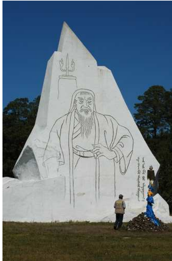
Fig. 3. Bas-relief sur pierre représentant Chinggis Khan et son étendard blanc, par le sculpteur Mahbal, installé sur le lieu dit de sa naissance en 1962 à l'occasion de la commémoration du huit centenaire de sa naissance. Delüün Boldog (« Sept collines isolées »), Gurvan Nuur (« Trois lac »), Dadal sum, province du Hentij. © Christian Stanley ( www.chrisstanley.com )

commémoration était organisée par la « Société Chinggis Khan », créée par Dožoodorž, journaliste connu. Des discours, des poèmes, des chants, des danses, de la musique pop et des cavalcades se succédèrent. Sur la grande place, une reproduction d'une peinture de Chinggis Khan montée sous forme de thanangka dominait la foule 25 .