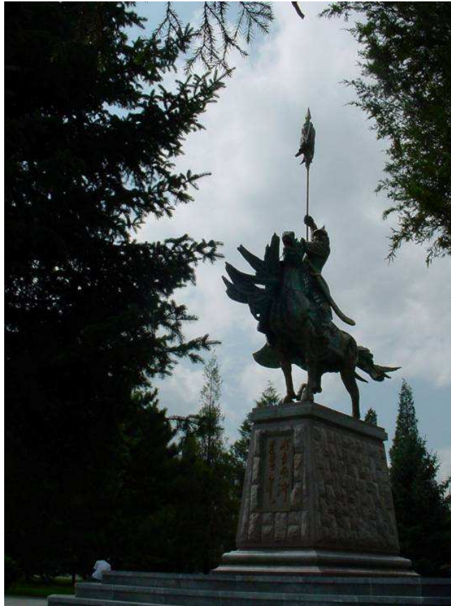
Fig. 23. Statue équestre de Chinggis Khan, par Ba Zhongwen 巴忠文 (Mongol du Hulun Buir, né en 1938), érigée dans l'Université de Mongolie-Intérieure.