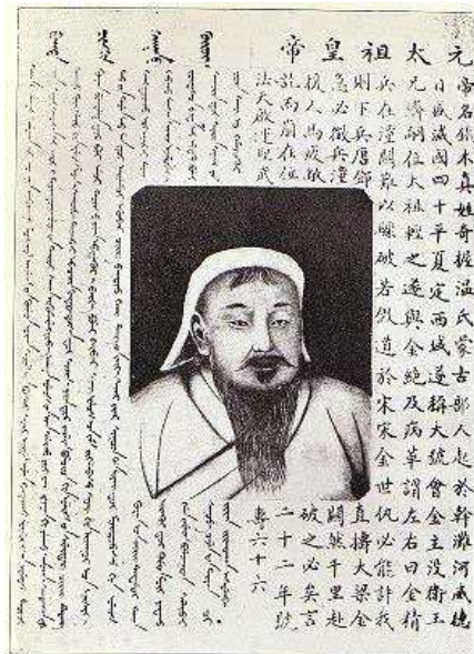
Fig. 7. Reproduction du « portrait de Taipei » accompagnée d'une notice biographique, publié peu avant 1925 par une imprimerie mongole de Pékin. Le titre de la légende du portrait de Chinggis Khan est « Boγda Cinggis qaγan-u köriig » (portrait du Saint empereur Chinggis) / « Yuan Taizu huangdi » (empereur Taizu des Yuan). Conservé dans les Archives de Mongolie-Intérieure à Hohhot : Guan Guangyao & Wu Jianhui (dir.), Zhongguo dang'an jingcui : 16 ; reproduit par Werner, « The burial-place » : face p. 80. Texte et traduction de la notice mongole par Mostaert, « À propos de quelques portraits » : 155-156.

Il semble que ce jugement provient tant de la localisation du portrait (Pékin puis Taipei), de son lieu de fabrication (Pékin) et du style pictural que du costume et de la coiffe du Khan, très différents de ce que les Mongols Halh portent depuis plusieurs siècles 47 . Alors qu'il est courant d'entendre en Mongolie que l'auteur ou le commanditaire du portrait était chinois, il est pourtant présenté officiellement comme étant le portrait mentionné dans « L'Histoire des Yuan », réalisé en 1278 par un artiste et haut fonctionnaire mongol nommé Qoryosun (voir ci-dessous) 48 . Son attribution à la dynastie Yuan n'est pas pour autant une garantie d'« authenticité » – les Yuan étant jugés par les Halh comme une dynastie sinisée, Khubilai étant même présenté parfois comme un usurpateur. C'est ainsi que ce portrait, « incontournable » mais jugé incorrect, est réinterprété, complété, détourné mais rarement ignoré par les artistes dans la Mongolie d'aujourd'hui 49 .