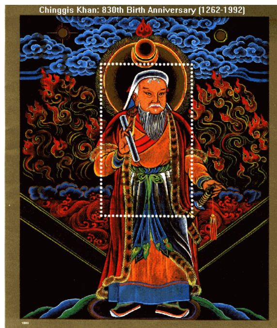
Fig. 19. Radnaabazar, Chinggis Khan, timbre émis à l'occasion du 830 e anniversaire du Khan en 1992.