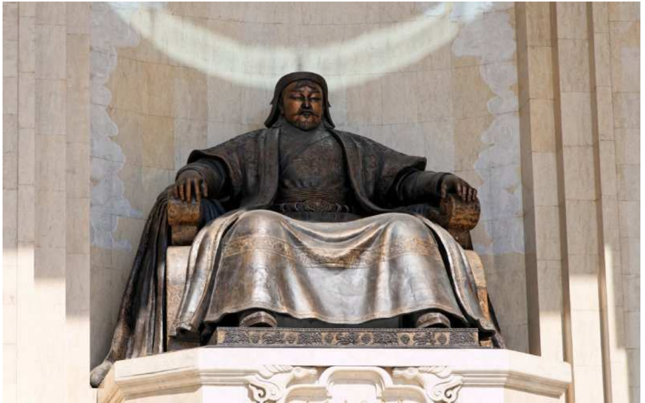
Fig. 1. « Le conquérant du monde », par L. Bold. Cette statue de Chinggis Khan sur la place Sükhbaatar à Ulaanbaatar (5.5 m de haut pour la statue, 1,8 m de haut pour la base de marbre) fut inaugurée le 10 juillet 2006. Sur l'artiste : http://www.uma.mn/gallery.jsp?id=19&apage=0&type=2#selected , consultée le 28 janvier 2008).

En juillet 2006, un « Monument au grand maître Chinggis Khan » ( Ih ezen Čingis haany höšöö ) abritant les statues monumentales de Chinggis Khan, Ögödei, Khubilai et des généraux de Chinggis Khan fut inauguré sur la place Sükhbaatar, devant le Palais du gouvernement dont il masque la façade ( fig. 1 ). Ce nouveau monument a pris la place du mausolée de Sükhbaatar et Choibalsan : Chinggis Khan est devenu le symbole absolu de la nation mongole, reléguant les héros du communisme à un statut inférieur 6 . C'est ce que Caroline Humphrey appelle « l'imitation historique » (en anglais « mimicry », par opposition à « embodiment » 7 ), c'est-à-dire l'intention de reproduire des événements ou objets sélectionnés du passé tout en restant conscient que l'événement présent n'est qu'un simulacre (les nouveaux étendards, par exemple, n'ont pas été « animés » 8 ). Toutes ces reconstitutions nationalistes, comme la grande commémoration de 2006 et le monument de