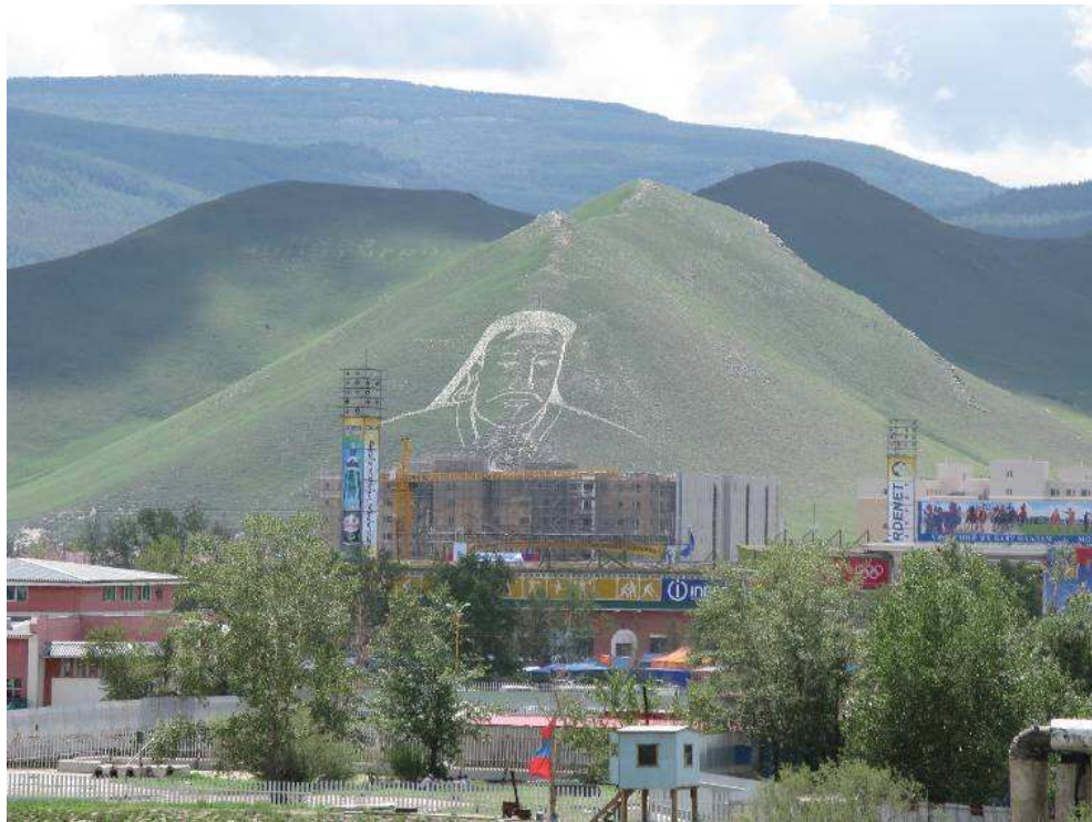
Fig. 2. Portrait de Chinggis Khan en pierres blanches sur une colline d'Ulaanbaatar, 2008.

La multiplication de l'image de Chinggis Khan est telle qu'on ne la remarque même plus. Comme le soulignait Christopher Kaplonski, il n'est plus depuis la fin des années 1990 l'objet des conversations tant il est devenu un « lieu commun » : « there is little need to debate the importance of a figure that everyone agrees is important », he « has become a part of everyday life » 12 . Les autorités comme les particuliers 13 s'inquiètent d'ailleurs de la multiplication et de la banalisation de l'image et du nom de Chinggis Khan comme marque de fabrique de produits commerciaux (vodka, boisson énergétique, café, hôtel, banque...) 14 – et pourtant, comme le fait remarquer Maurice Agulhon à propos de la « semeuse » française utilisée dans quantité d'emplois dérivés, affiches publicitaires, objets utilitaires de fantaisie : « il n'y a pas de popularité vraie sans familiarité souriante » 15 . Aussi les autorités mongoles ont-elles tenté à plusieurs reprises de légiférer, en proposant un projet de loi probablement inspiré par la loi chinoise de 2005 sur l'image de Confucius. Les principaux arguments avancés sont que la nature même de certains produits peut manquer de respect au Khan ; que la multiplication des utilisations de son nom peut entraîner une dilution du symbole (« éviter que la mémoire du conquérant légendaire ne soit bradée » 16 ) ; enfin et surtout, que des firmes étrangères (chinoises et russes en particulier) font des