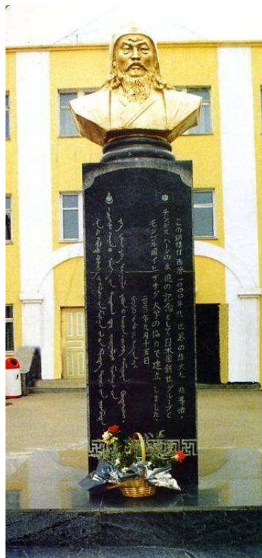
Fig. 16. Buste de Chinggis Khan surmontant une stèle bilingue mongol-japonais, Université Ih Zasag Chinggis Khan, Ulaanbaatar, 2000.