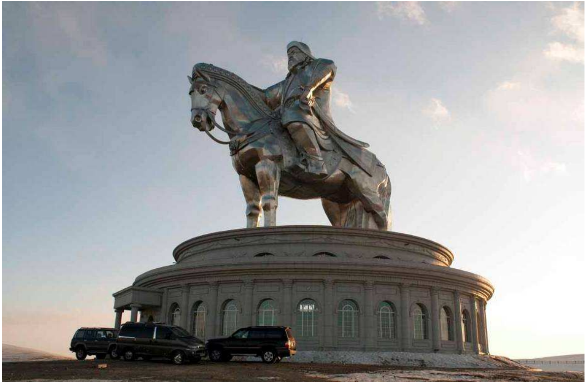
Fig. 5. D. Erdembileg, Grande statue équestre de Conžin Boldog, Erdene sum, province Töv, Mongolie. La statue de 42m de haut (incluant le piédestal) se situe au centre d'un complexe de 80 m 2 ; à sa base se trouvent un musée des Khan, une salle d'exposition, un restaurant, des salles de conférences, des boutiques de souvenir etc. ; autour, un camp touristique de huit cent yourtes. Un ascenseur intérieur permet d'atteindre le sommet.

gengiskhanides et relations étrangères, investit également dans le tourisme archéologique 35 , et a fondé en 2005 un musée de Chinggis Khan et un camp touristique à Terelž, ainsi qu'un complexe touristique à Harhorin (ancienne Kharakhorum). La Société Hünü, fondée en 1992, dédiée à l'éducation et au tourisme, joue également sur les deux plans : en 1994, elle établit à Ulaanbaatar l'Université Ih Zasag 36 , et fonda dans les années 2000 plusieurs musées et camps touristiques.