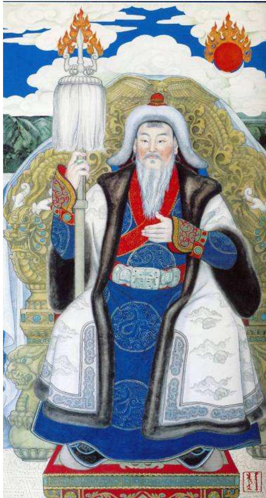
Fig. 25. Sečen Bilig (Si Qin 思沁), « Chinggis Khaan ». © Sečen Bilig