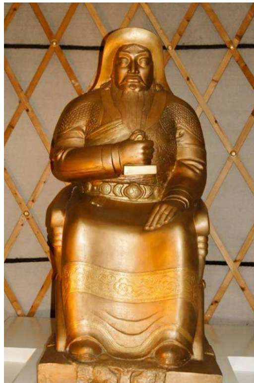
Fig. 17. Statue de Chinggis Khan, un sceau à la main, au Musée d'Histoire Nationale d'Ulaanbaatar, entre les étendards blanc et noir, sous une yourte au treillis apparent.

La statue de Chinggis Khan sur la place Sühbaatar figure le Khan assis « comme dans les anciennes gravures [sculptures] sur pierre » 112 , même si l'aspect massif, bras et jambes écartés, lui donne une horizontalité écrasante, bien différente de l'attitude des « hommes de pierre » ( hiin čuluu ) de la steppe. D'autres statues s'inspirent plus directement d'un des « hommes de pierre » – statues funéraires d'hommes et de femmes assis sur une chaise et tenant une coupe à la main – les mieux préservés de l'époque impériale 113 . Au musée d'Histoire d'Ulaanbaatar, une statue en bronze montre le Khan assis sur une chaise pliante, un sceau dans sa main droite levée : la coupe des « hommes de pierre » est remplacée par un sceau qui n'a rien sur quoi se poser ( fig. 17 ) 114 . La chaise pliante d'origine chinoise ( jiaoyi 交椅), à dos rond, accoudoirs et repose-pied, symbole de prestige sous les Yuan, est donc perçue comme un siège typique des empereurs mongols. Une statue tout à fait similaire, mais tenant à la main, comme les « hommes de pierre », une coupe à haut pied, a été récemment installée dans le « Centre à la mémoire de Chinggis Khan » fondé par l'Université Ih Zasag à Terelž 115 . Les artistes réinventent donc une représentation conforme à l'idée qu'ils se font de l'art du XIII e -XIV e siècles, greffant sur la statue visage et coiffe suivant le « portrait de Taipei ».