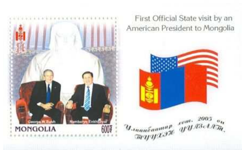
Fig. 4. Timbre émis en 2005 suite à la rencontre entre les présidents Bush et Enhbajar devant le portrait de Chinggis Khan en marbre blanc de la yourte de réception (le président Bush n'était pas allé jusqu'au Palais, la yourte avait été déplacée près de l'aéroport).

juin 2000, à l'Université Ih Zasag, le chamane Bjambadorž appella l'esprit de Chinggis Khan devant l'étendard et une statue du Khan, et lui demanda de détruire tous les malheurs de la nation afin de construire une grande Mongolie, tandis que l'Académie de la Culture Nomade octroyait l'ordre de Chinggis Khan à des scientifiques 27 . C'est devant la statue de Chinggis en marbre blanc trônant dans la yourte de réception du Palais du gouvernement qu'a été prise la photographie officielle sur laquelle les présidents Bush et Enhbajar se serrent la main en novembre 2005 28 . L'écrasante statue assise, deux fois plus haute que les chefs d'État, est encore agrandie sur les timbres commémorant la visite (fig. 4).