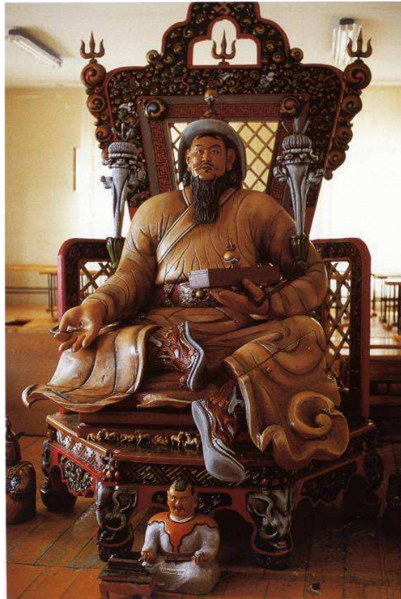
Fig. 14. Statue de Chinggis Khan sur un trône, installée dans la faculté de droit.

Malgré ces invariants, le visage peut toutefois être difficilement identifiable lorsqu'il n'est plus arrondi et bienveillant. Sur un portrait en bas-relief souvent reproduit dans les années 1990, Chinggis Khan jeune, de face, a des pommettes hautes, un visage sévère doté d'une moustache mais sans barbe, les sourcils sévèrement froncés ( fig. 11 ) 100 . Bien que le chapeau d'hiver, les mèches sur le front, les boucles de cheveux du « portrait de Taipei » soient conservés, la sévérité du visage émacié l'en distinguent radicalement. Cette sévérité inspire de la force au visage rajeuni, le « portrait de Taipei » étant parfois jugé comme celui d'un vieillard débonnaire. Pourtant, le portrait ainsi rajeuni ne semble pas être parvenu à s'imposer, et la stèle qui le représentait a été remplacée en 2006 par une nouvelle stèle ornée du portrait bienveillant « de Taipei » 101 .