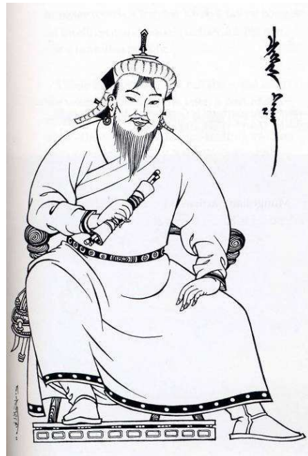
Fig. 13. Dessin au trait, « Chinggis Khan comme homme d'État », par Ćimiddorž, 2001.

Le vêtement est colorisé, modifié (rajout d'un vêtement de dessus ( fig. 1, fig. 3 ), d'un ornement souvent fantaisiste ( fig. 6, fig. 15 ), de motifs floraux 98 . Un miroir, objet à forte connotation symbolique renvoyant aux divinités s'incarnant dans un oracle et aux protecteurs héroïques du bouddhisme tibétain, orne parfois sa poitrine ( fig. 8 ) 99 . Les cheveux tressés en anneaux derrière les oreilles sont parfois supprimés ( fig. 3 ) ou interprétés comme des boucles d'oreille. La fourrure du chapeau d'hiver est rendue grossièrement visible ( fig. 13 ). En fin de compte, les copies modifient les traits de l'original, mais reprennent un ensemble d'invariants qui font inmanquablement penser au portrait de Taipei : touffe de cheveux sur le front, chapeau, tresses, yeux allongés et bridés, moustache et barbe, robe croisée. La version la plus simplifiée est le gigantesque portrait en pierre sur une colline d'Ulaanbaatar, dans lequel l'original reste reconnaissable ( fig. 2 ).