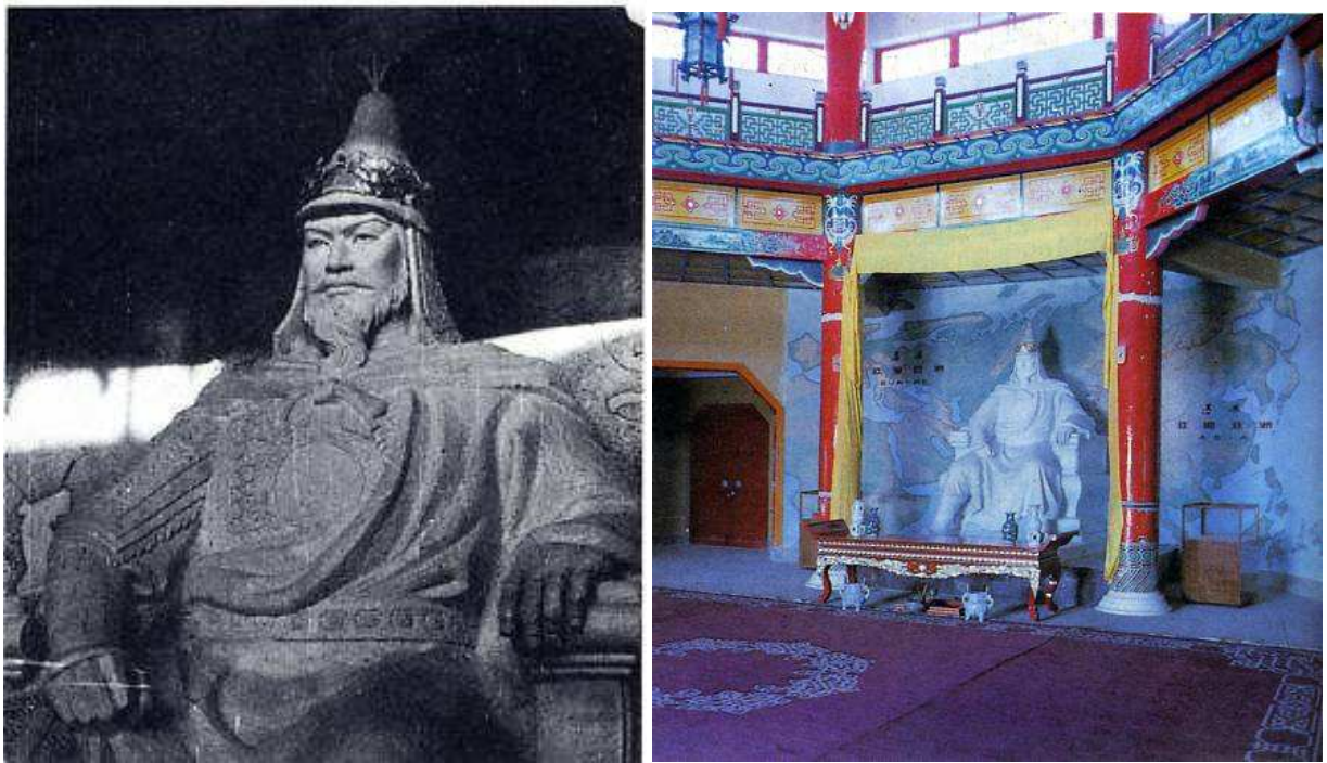
Fig. 21. Statue dans la salle centrale du « Mausolée » de Chinggis Khan dans les Ordos, installée en 1980. © Sayinsiyal 1991 [1987], fig. 25A et 83.

Pendant ce temps, les découvertes de portraits de Chinggis Khan continuent. En 2006, c'est au Badγar coiling süme, connu aujourd'hui sous le nom de Wudang zhao 五當召 (<Mong. Udan zuu), le principal monastère de Mongolie-Intérieure, qu'est exhumé un lot de 466 thangkas comprenant une peinture martiale de Chinggis Khan 168 . Identifié par une inscription, Chinggis brandit une bannière décorée d'un swastika dans sa main droite, porte arc et carquois rempli de flèches dans le dos, et chevauche un destrier blanc. D'après l'archéologue Wang Dafang, il daterait « certainement du XIX e siècle » 169 . Son casque, son visage et son destrier blanc ressemblent à ceux des peintures de Geser 170 .