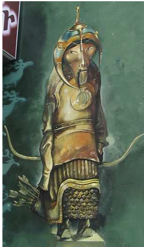
Fig. 12. Peinture murale à Ulaanbaatar près du Magasin d'État.