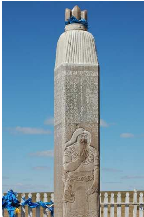
Fig. 6. Stèle de granit adoptant la forme de l'étendard blanc à l'effigie de Chinggis Khan sur fond de tamga, monument érigé pour commémorer le 750 e anniversaire de « L'Histoire secrète des Mongols », près du camp de la Société Hününü à Hödöö Aral (Herlengijn Hödöö Aral), Delgerhaan sum, province Hentij, en 1990. Hödöö Aral (au sud de Bayan Ulaan Uul), est une plaine de 30x20 km sur le fleuve Herlen (Kerülen) à 275 km d'Ulaanbaatar. À 6 km se trouve le lac Avarga Toson (objet de tourisme médical) et à 8 km, le site archéologique Aurug. Une cérémonie y fut organisée pour commémorer le 840 e anniversaire de la naissance de Chinggis, en 2006.

où Temüžin aurait été proclamé Khan près du lac Bleu (Har Zürhnij Höh Nuur), ou encore sur le mont Burhan Haldun. Sur ces sites, l'État n'investit que dans un monument 38 – généralement une stèle représentant Chinggis Khan – qui est périodiquement l'objet de cérémonies commémoratives, tandis que les agences privées établissent des musées et des complexes touristiques. Parmi ces monuments, on citera, outre la stèle érigée à Delüün Boldog en 1962 pour le huit centenaire de sa naissance ( fig. 3 ), la stèle gravée en écriture mongole ancienne et ornée de son portrait, œuvre de Hurcgerel en 1989, installée sur le mont Burhan Haldun 39 , le pilier-stèle érigé pour le 750 e anniversaire de « L'Histoire secrète des Mongols » en 1990 à Hödöö Aral ( fig. 6 ) ; et la stèle érigée par Ugtaabajar près de Cenher Mandal, site où Temüjin aurait été proclamé Khan en 1189, pour commémorer les 840 ans de la naissance de Chinggis Khan en 2002 40 .